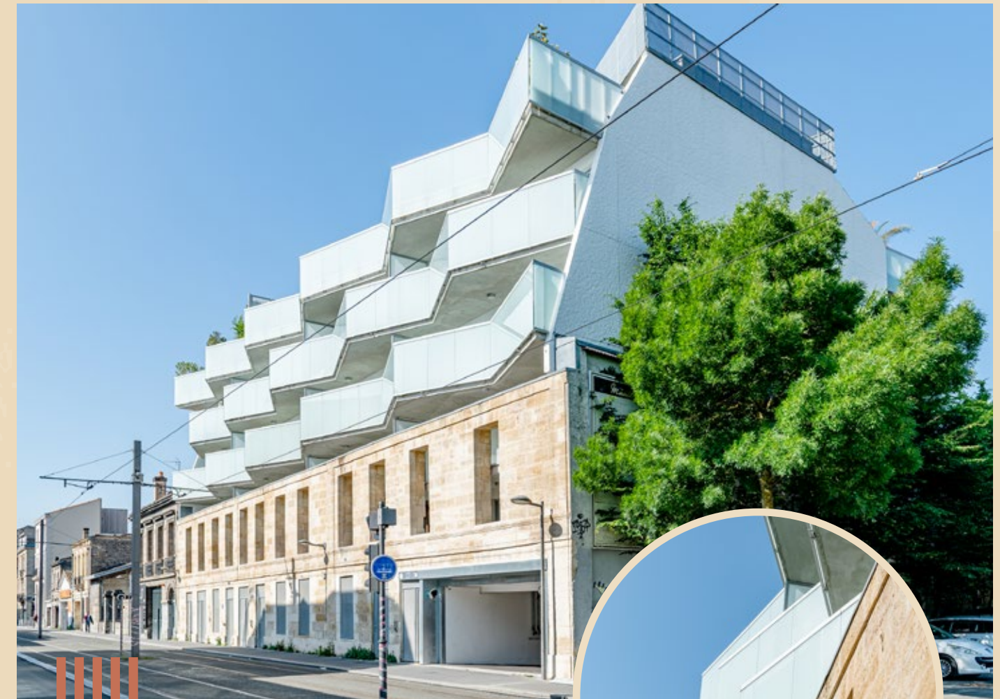
CRYSTAL CHARTRONS BORDEAUX (33)

DÉCOUVREZ UNE RÉALISATION EXEMPLAIRE DANS VOTRE RÉGION