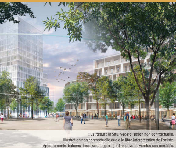
Illustrateur : In Situ. Végétalisation non contractuelle. Illustration non contractuelle due à la libre interprétation de l'artiste. Appartements, balcons, terrasses, loggias, jardins privatifs vendus non meublés.

Déployé sur 65 hectares, cet écoquartier offre un cadre de vie diversifié, vert et dynamique. Il offre aux futurs logements une qualité de vie à travers ses multiples commerces, espaces verts et équipements scolaires et sportifs.