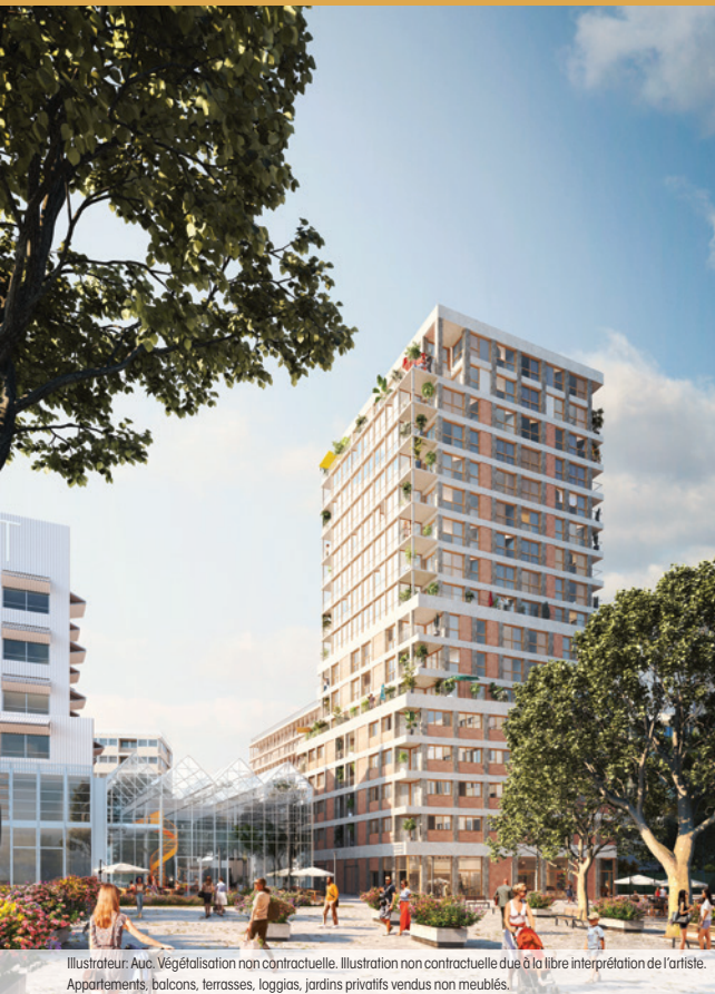
Illustrateur: Auc. Végétalisation non contractuelle. Illustration non contractuelle due à la libre interprétation de l'artiste. Appartements, balcons, terrasses, loggias, jardins privatifs vendus non meublés.