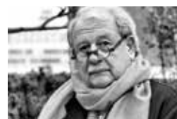
Anthony BECHU Agence d'Architecture Anthony Béchu & Associés

L'Hôpital de Saint-Germain-en-Laye est né de la vocation à accueillir des patients, à les soigner et à apporter une certaine forme de bien-être à la société de son époque. Nous souhaitons pérenniser cette recherche du bien-être et transformer le quartier de l'Hôpital en tenant compte de ses racines, tout en l'inscrivant dans une société en évolution permanente.