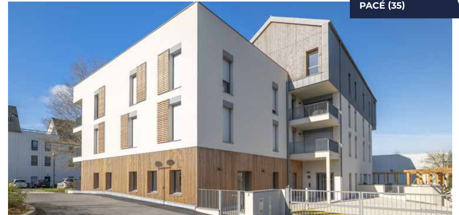
CARRÉ SURCOUF PACÉ (35)