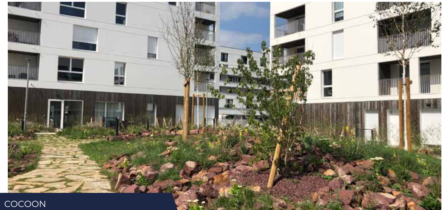
COCOON SAINT-JACQUES-DE-LA-LANDE (35)