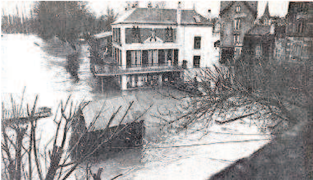
Collection Le Fil du Temps © Chantal Leduc