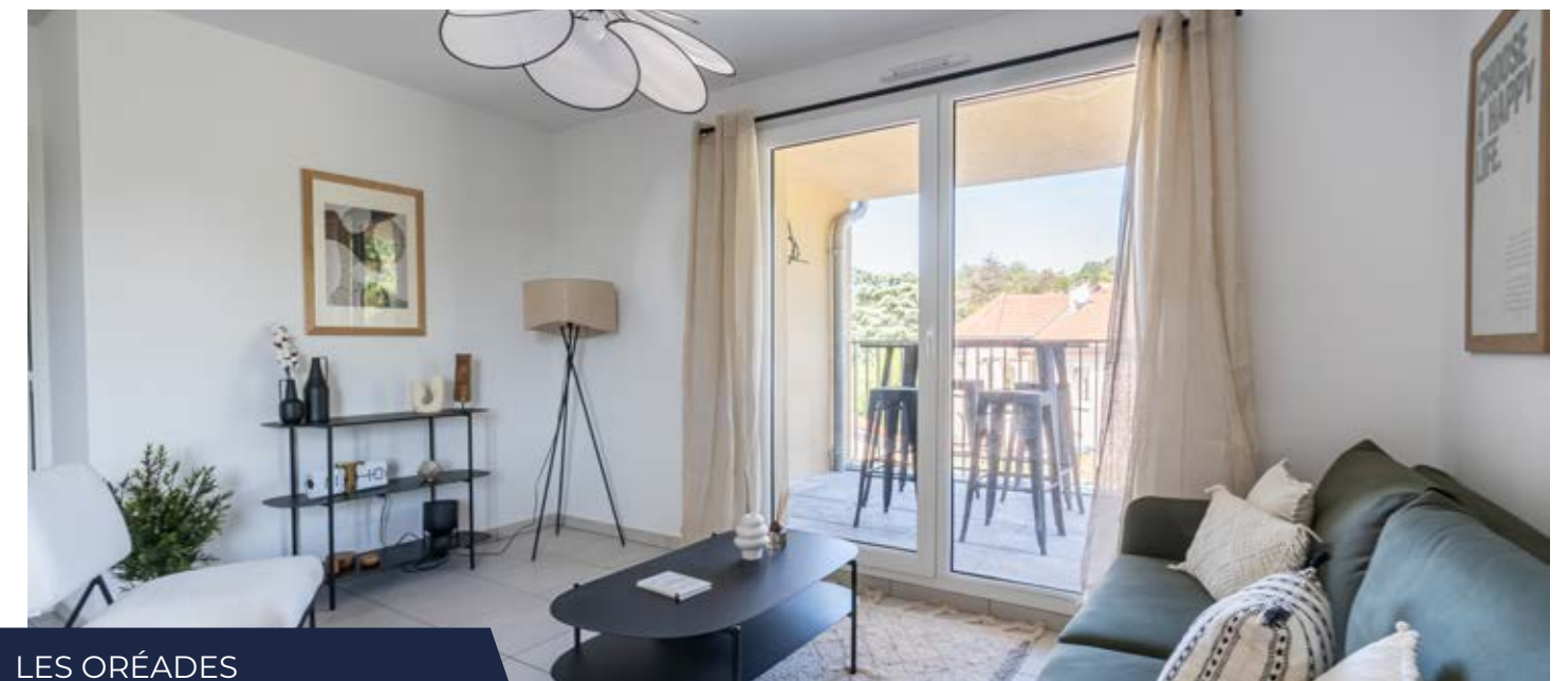
LES ORÉADES NEUVILLE-SUR-SAÔNE (69)