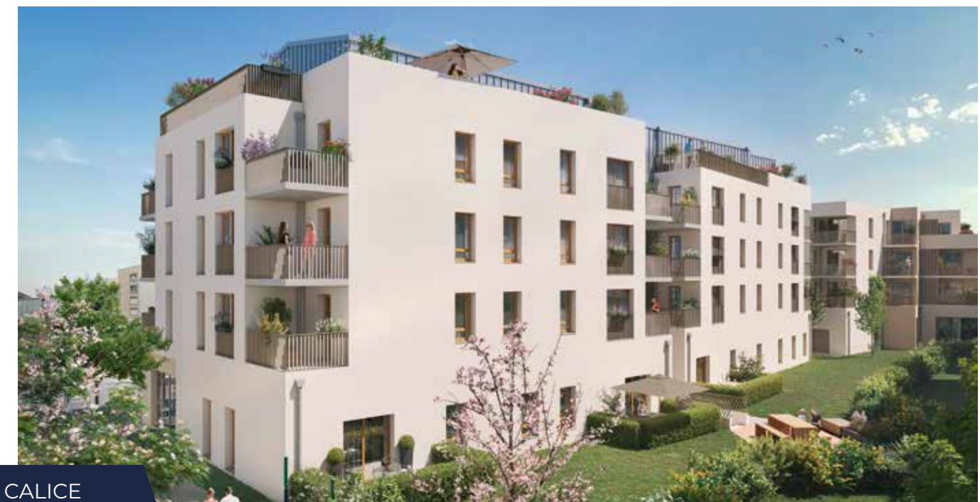
LE CALICE BRIGNAIS (69)