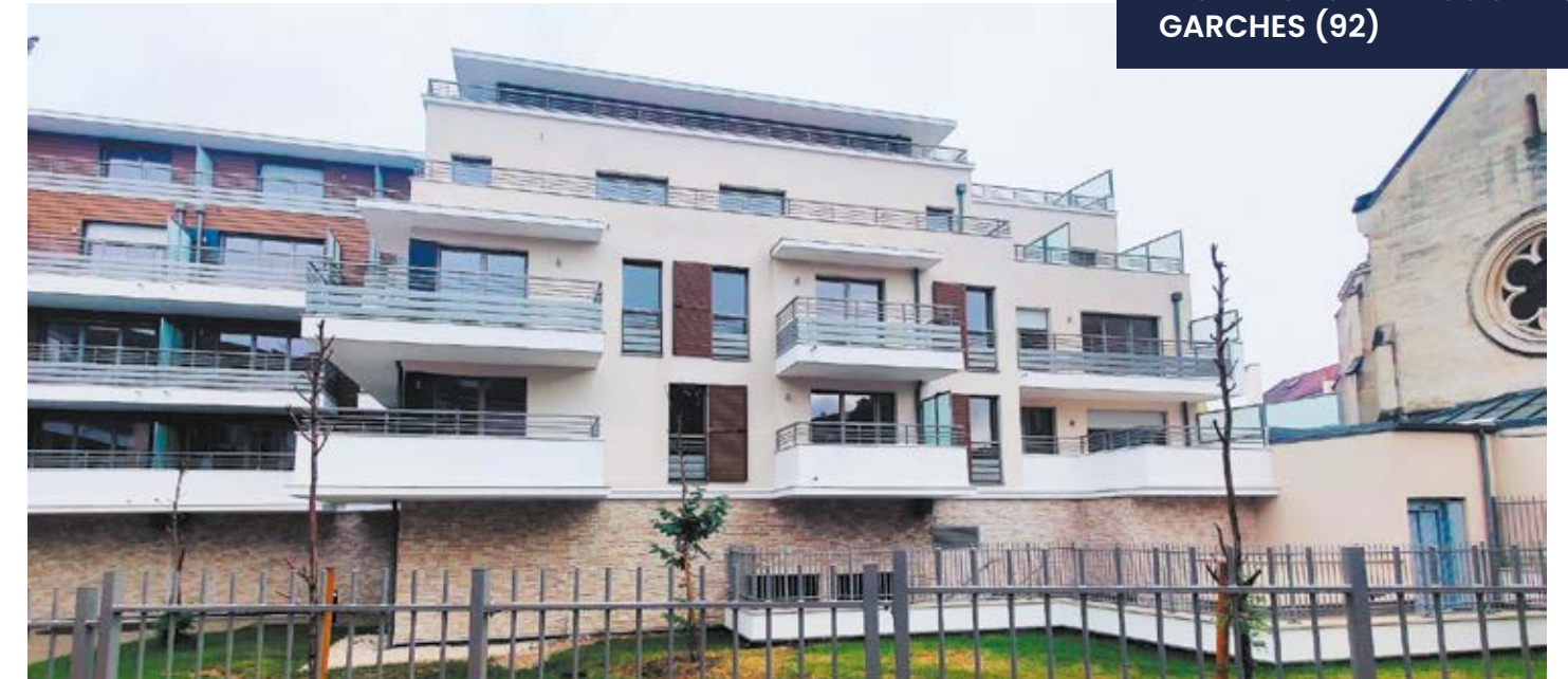
RÉSIDENCE SAINT-LOUIS GARCHES (92)