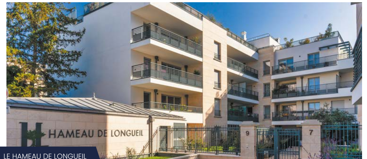
LE HAMEAU DE LONGUEIL MAISONS-LAFFITTE (78)