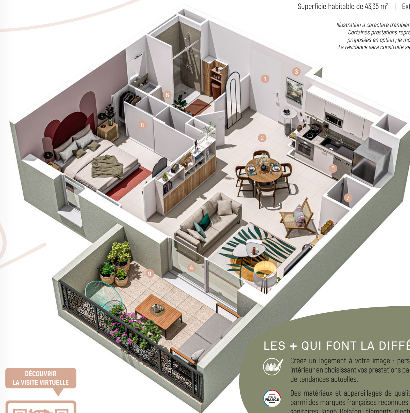
Illustration à caractère d'ambiance non-contractuelle. Certaines prestations représentées peuvent être proposées en option ; le mobilier n'est pas fourni. La résidence sera construite selon la notice notariée.

Un exemple de T2 Superficie habitable de 43,35 m 2 | Extérieur de 8,40 m 2