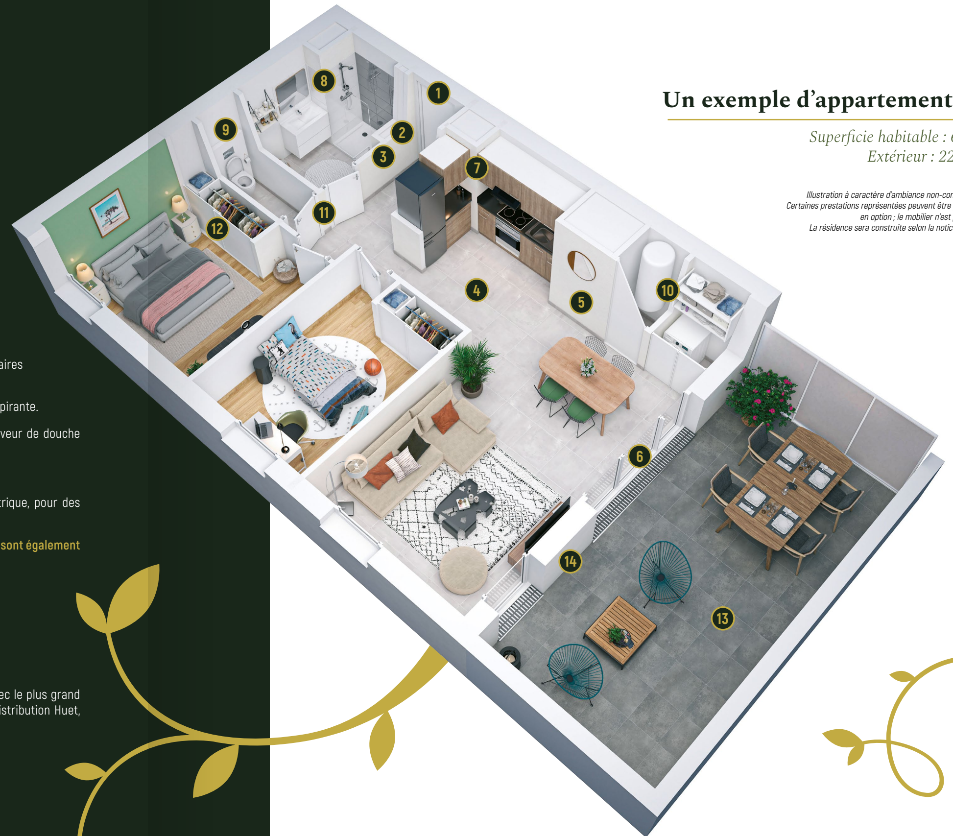
Illustration à caractère d'ambiance non-contractuelle. Certaines prestations représentées peuvent être proposées en option ; le mobilier n'est pas fourni. La résidence sera construite selon la notice notariée.

Superficie habitable : 62 m 2 Extérieur : 22,6 m 2