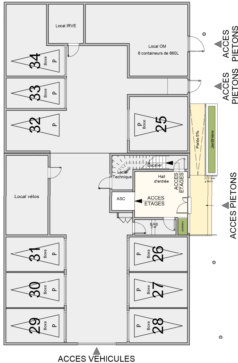
PLAN DE REPERAGE - RDC - BATIMENT E