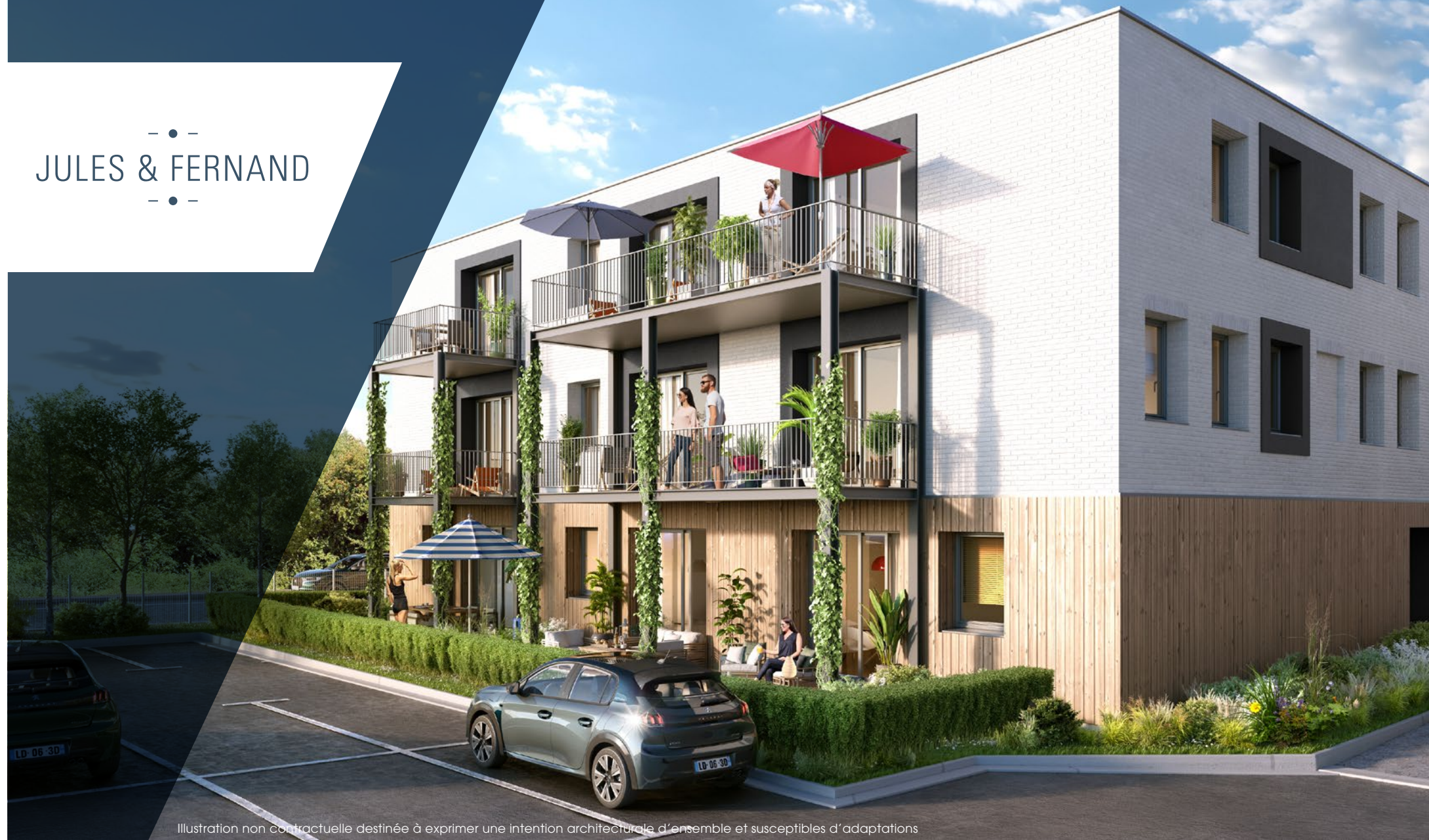
Illustration non contractuelle destinée à exprimer une intention architecturale d'ensemble et susceptibles d'adaptations