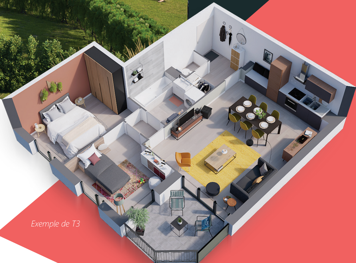
Exemple de T3