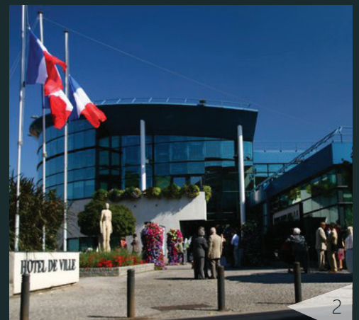
1. Gare RER de Savigny-sur-Orge 2. Mairie de Savigny-sur-Orge