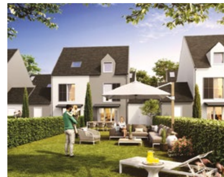
La villa d'Adrien - Étampes (91)