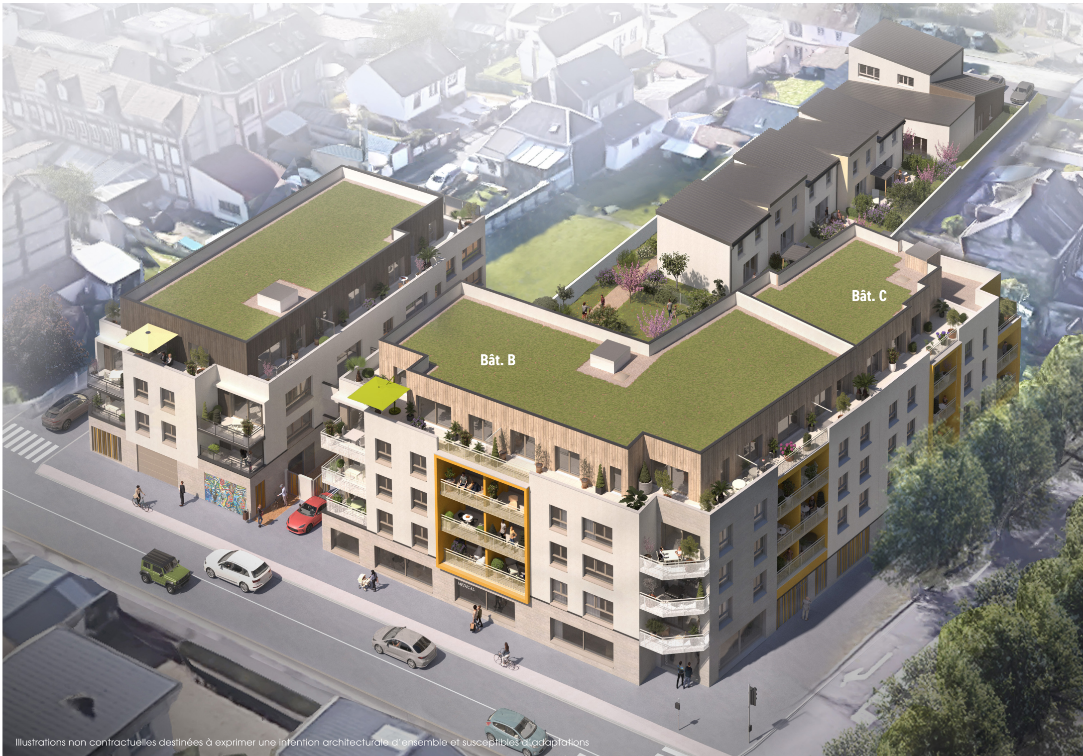
Illustrations non contractuelles destinées à exprimer une intention architecturale d'ensemble et susceptibles d'adaptations