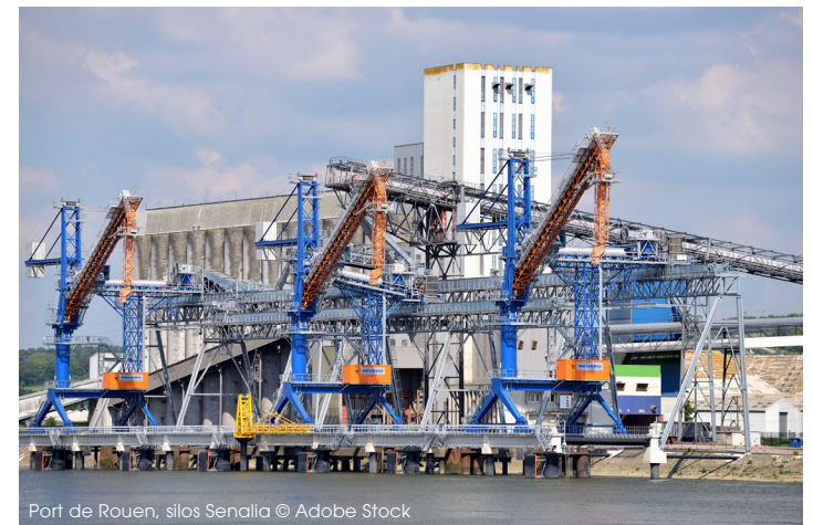
Port de Rouen, silos Senalia