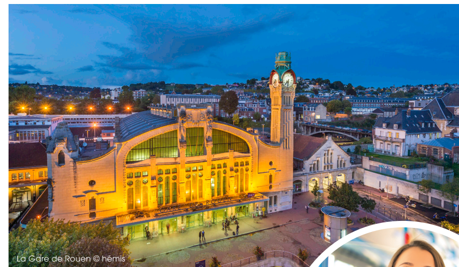
La Gare de Rouen

Relais du réseau régulier, la ligne reliant le centre-ville, les équipements culturels et de loisirs aux zones d'habitation