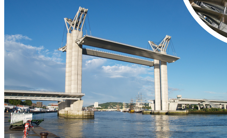
Le pont Gustave Flaubert

Future gare TGV : PARIS LA DÉFENSE - ROUEN - LE HAVRE D'ici 15 ans : Ligne LGV avec pôle multimodal Rouen Rive Gauche Rouen à 35 minutes de la Défense