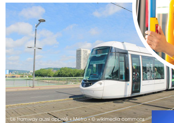
Le tramway aussi appelé « Métro »