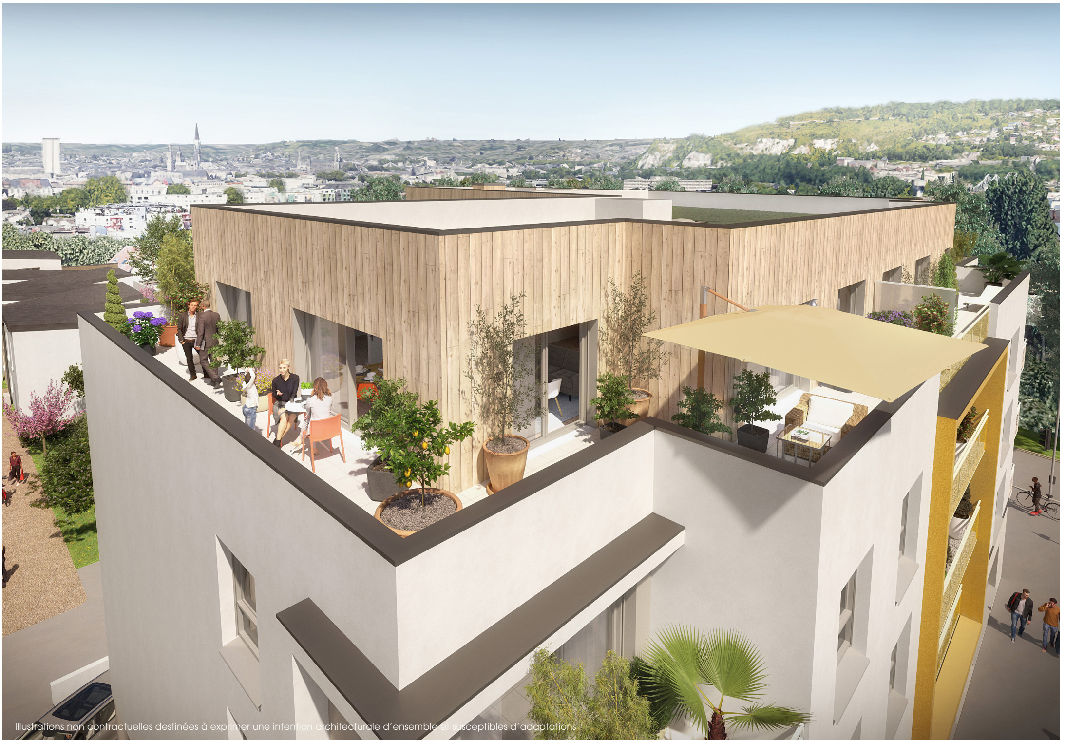
Illustrations non contractuelles destinées à exprimer une intention architecturale d'ensemble et susceptibles d'adaptations