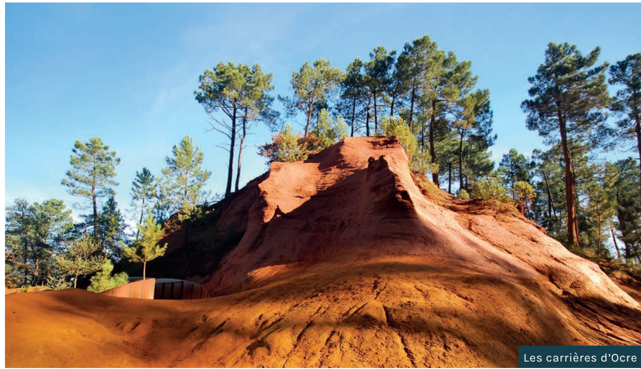
Les carrières d'Ocre