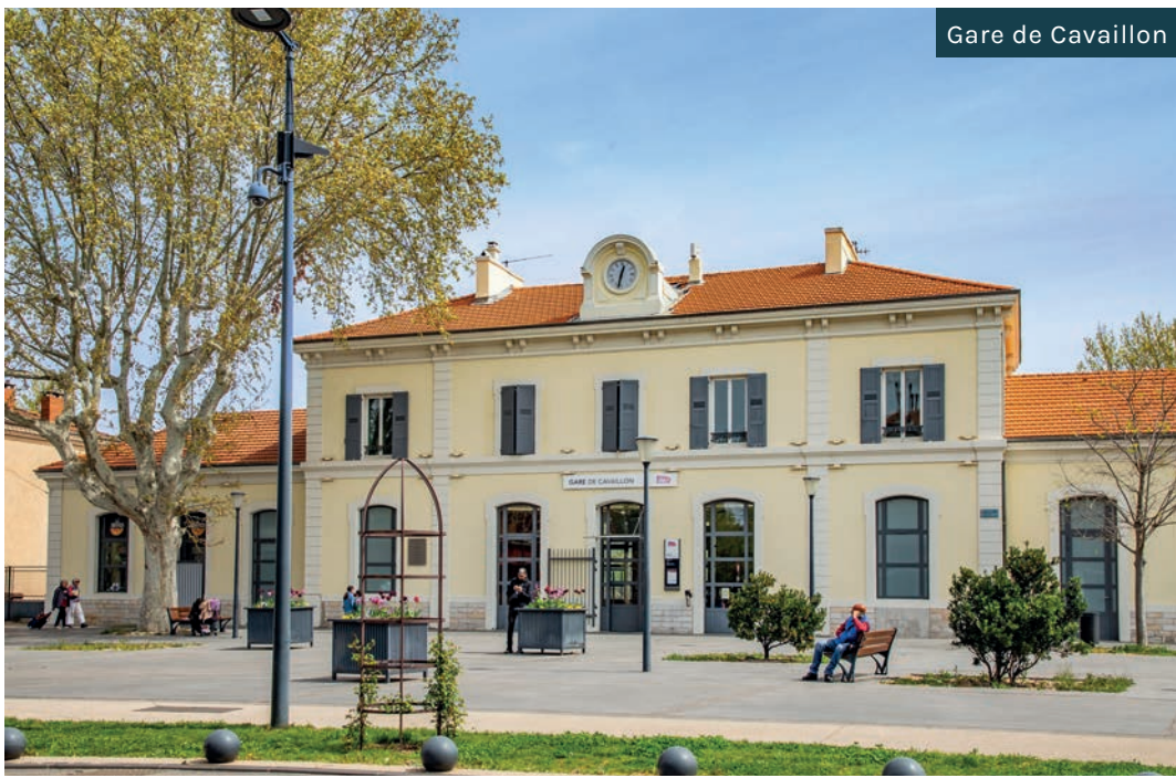
Gare de Cavailon