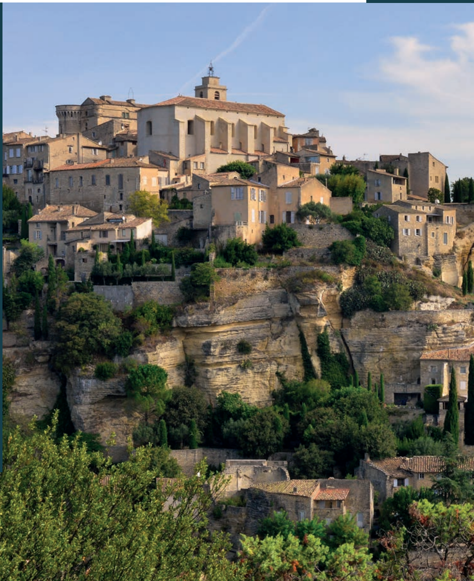
Village de Gordes