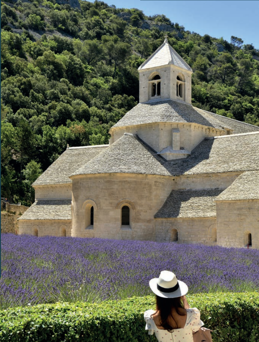
Abbaye Notre-Dame de Sénanque