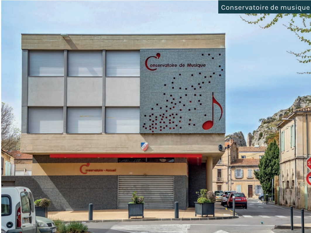
Conservatoire de musique