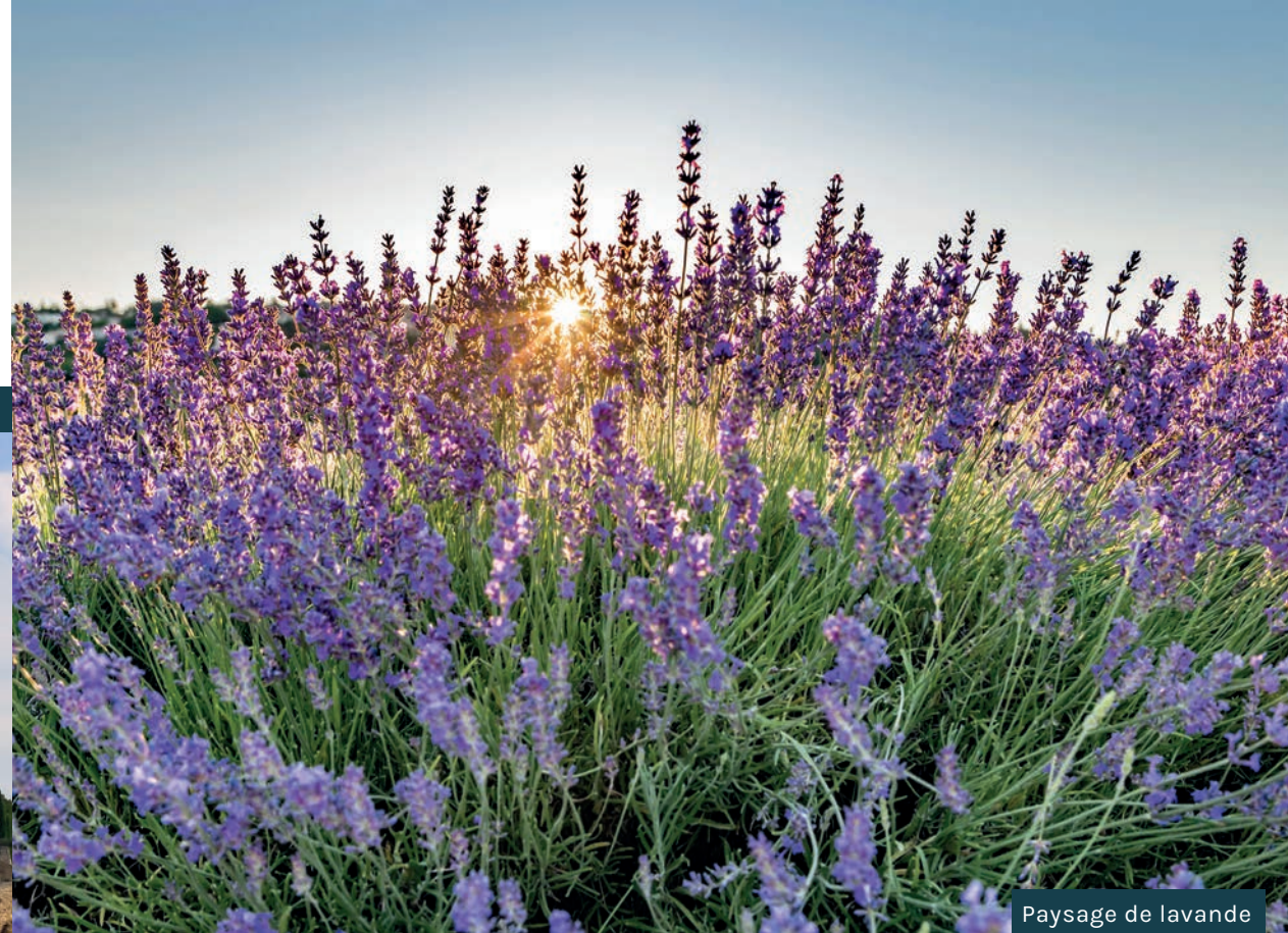
Paysage de lavande