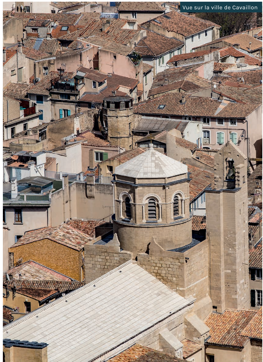
Vue sur la ville de Cavailon