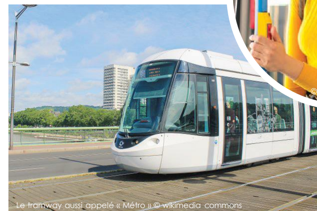
Le tramway aussi appelé « Métro »