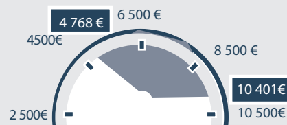
TABLEAU DES CHARGES (1) (2)