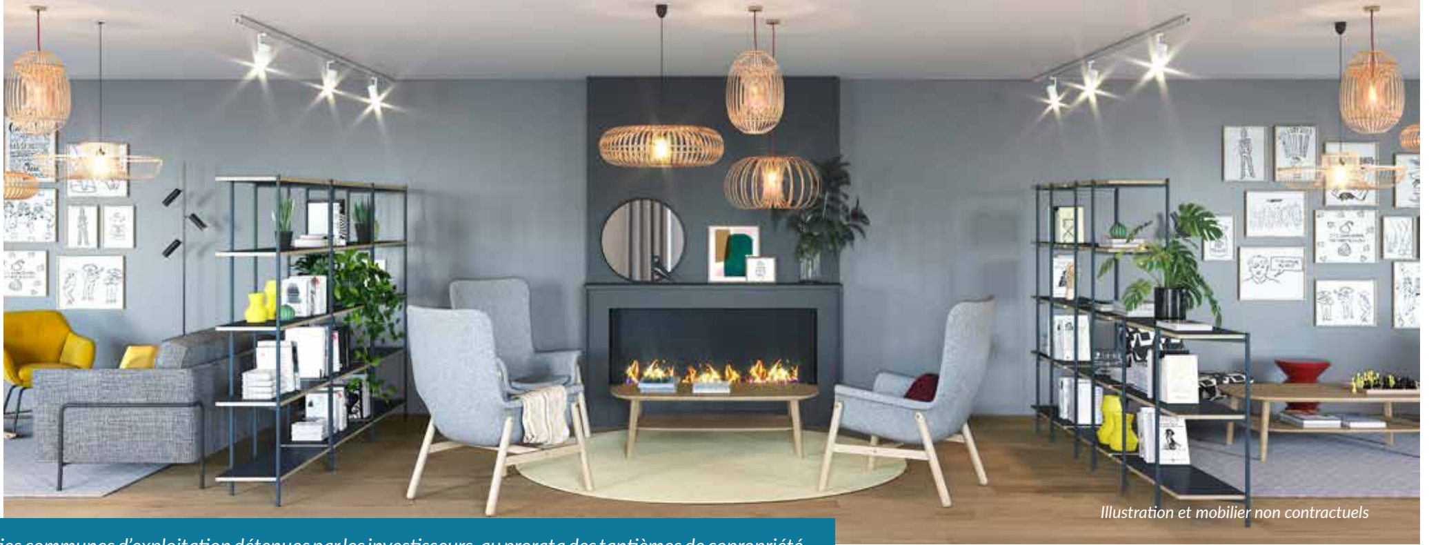
Illustration et mobilier non contractuels

Parties communes d'exploitation détenues par les investisseurs, au prorata des tantièmes de copropriété