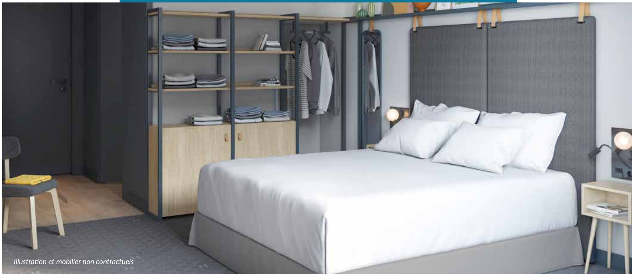
Illustration et mobilier non contractuels

125 logements de 21 à 47 m 2 déclinés du T1 au T2, aménagés avec kitchenette et coin bureau. Ils offrent un confort optimal pour des séjours agréables.