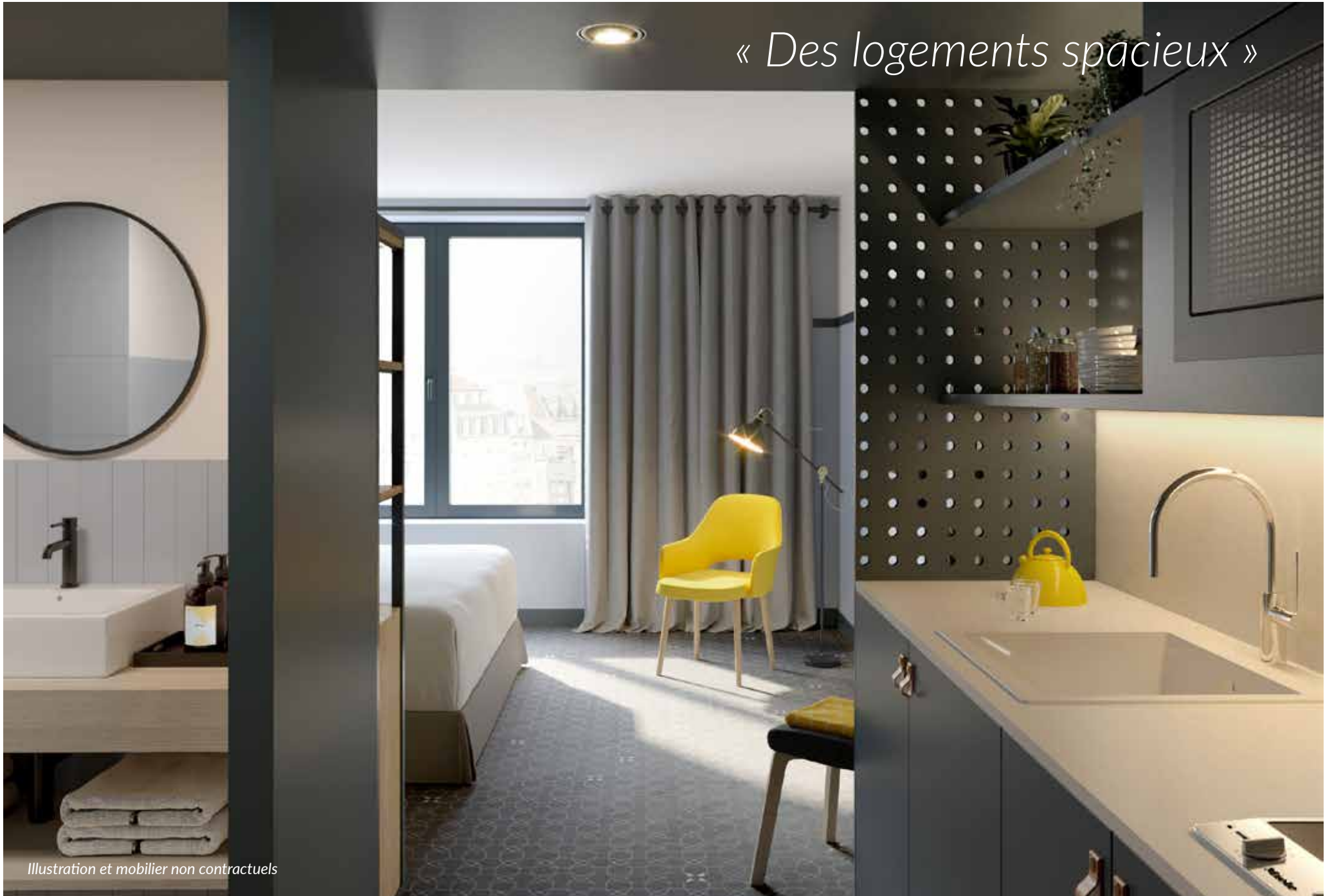
Illustration et mobilier non contractuels