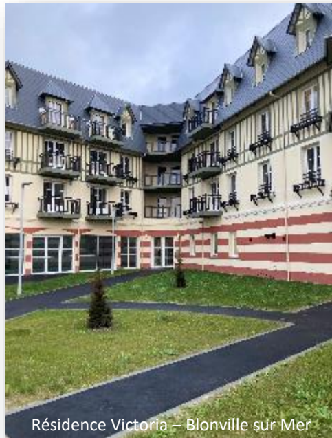
Résidence Victoria – Blonville sur Mer