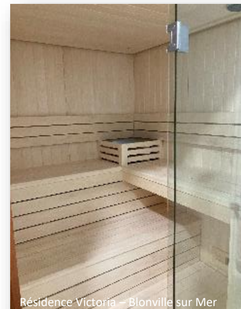
Résidence Victoria – Blonville sur Mer