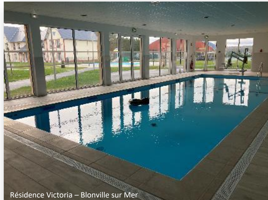
Résidence Victoria – Blonville sur Mer