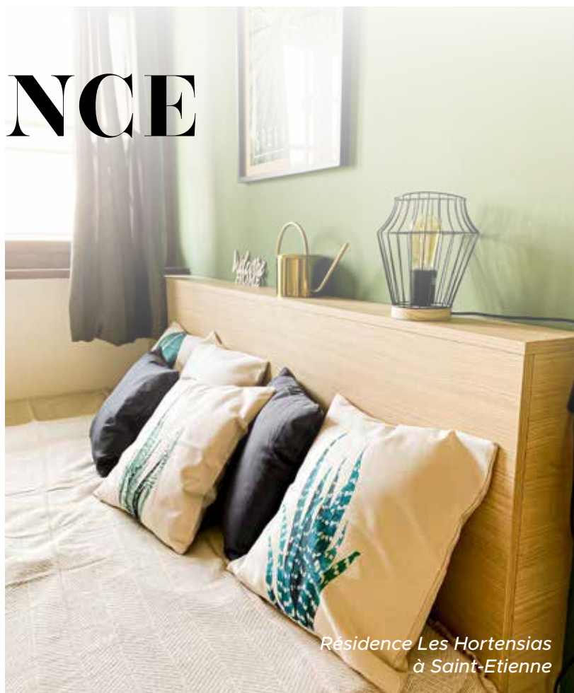
Résidence Les Hortensias à Saint-Etienne

Les intérieurs sont pensés dans les moindres détails pour créer une atmosphère accueillante.