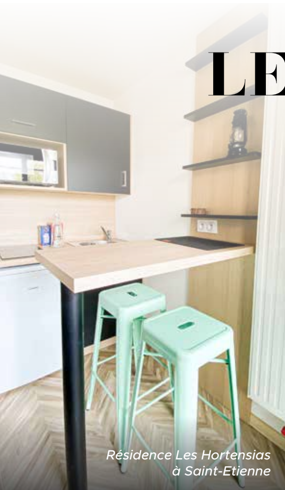
Résidence Les Hortensias à Saint-Etienne