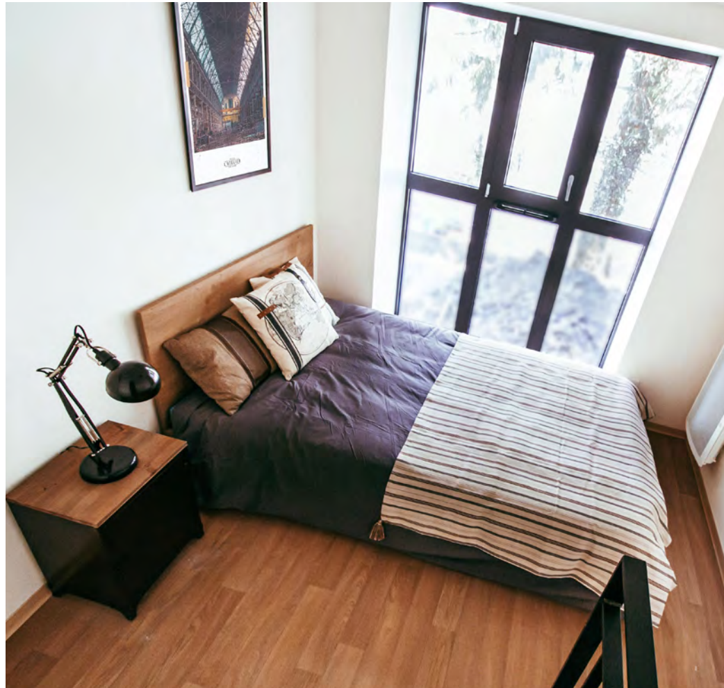
Photographie et mobilier non contractuels

Les studios sont intégralement meublés et équipés pour créer un lieu de vie chaud et moderne aux étudiants.