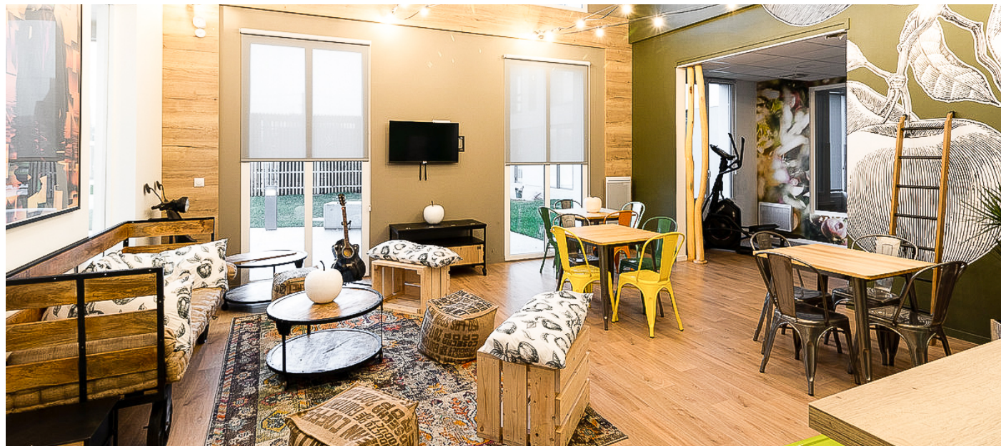
Photographie et mobilier non contractuels