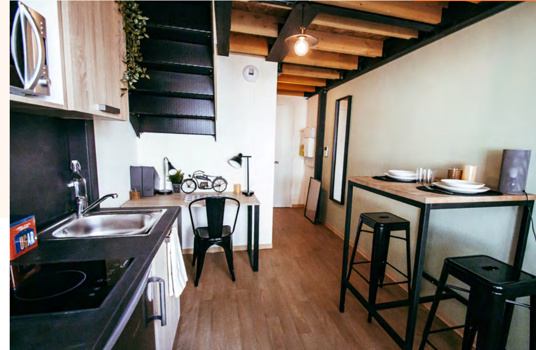
Photographie et mobilier non contractuels