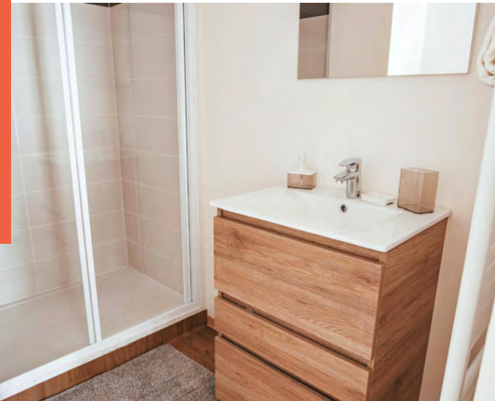
Photographie et mobilier non contractuels