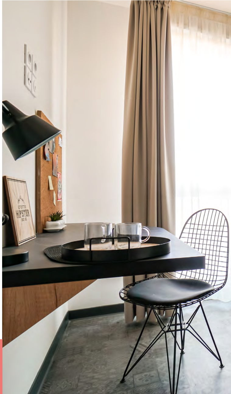
Photographie et mobilier non contractuels

Les studios sont intégralement meublés et équipés pour créer un lieu de vie chaud et moderne aux étudiants.