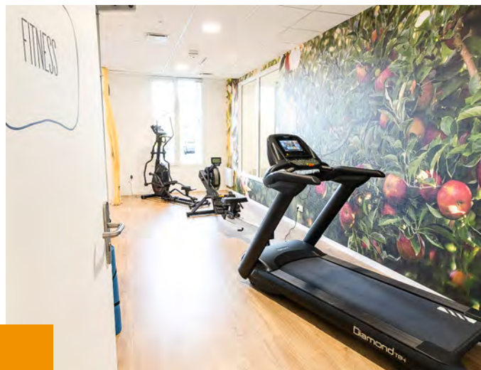
Photographie et mobilier non contractuels

La résidence est conçue autour du bien-être de ses résidents et propose 324 m² d'espaces communs , créant un véritable lieu de partage !