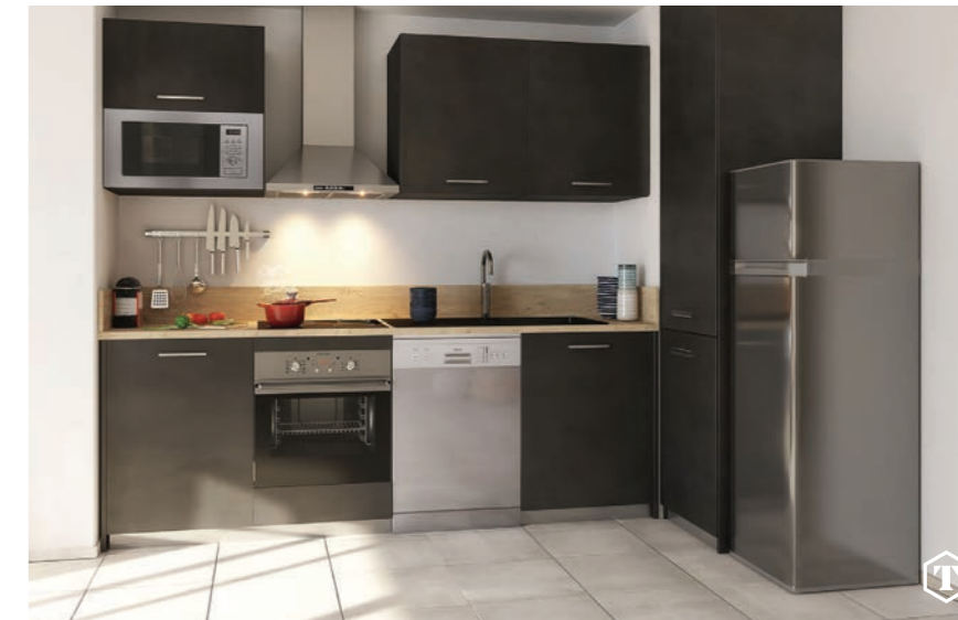
Cuisine type d'un logement 3 pièces meublée et entièrement équipée