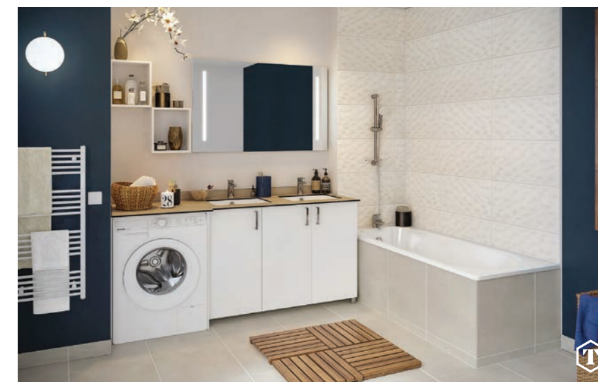
Aménagement et équipement type d'une salle de bain d'un logement 4 pièces

Des partenaires de confiance, des marques de qualité