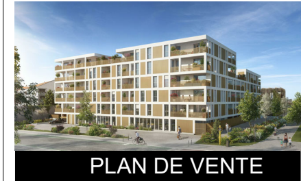
PLAN DE VENTE

OXYGEN 40 avenue de Fronton - Toulouse -31000