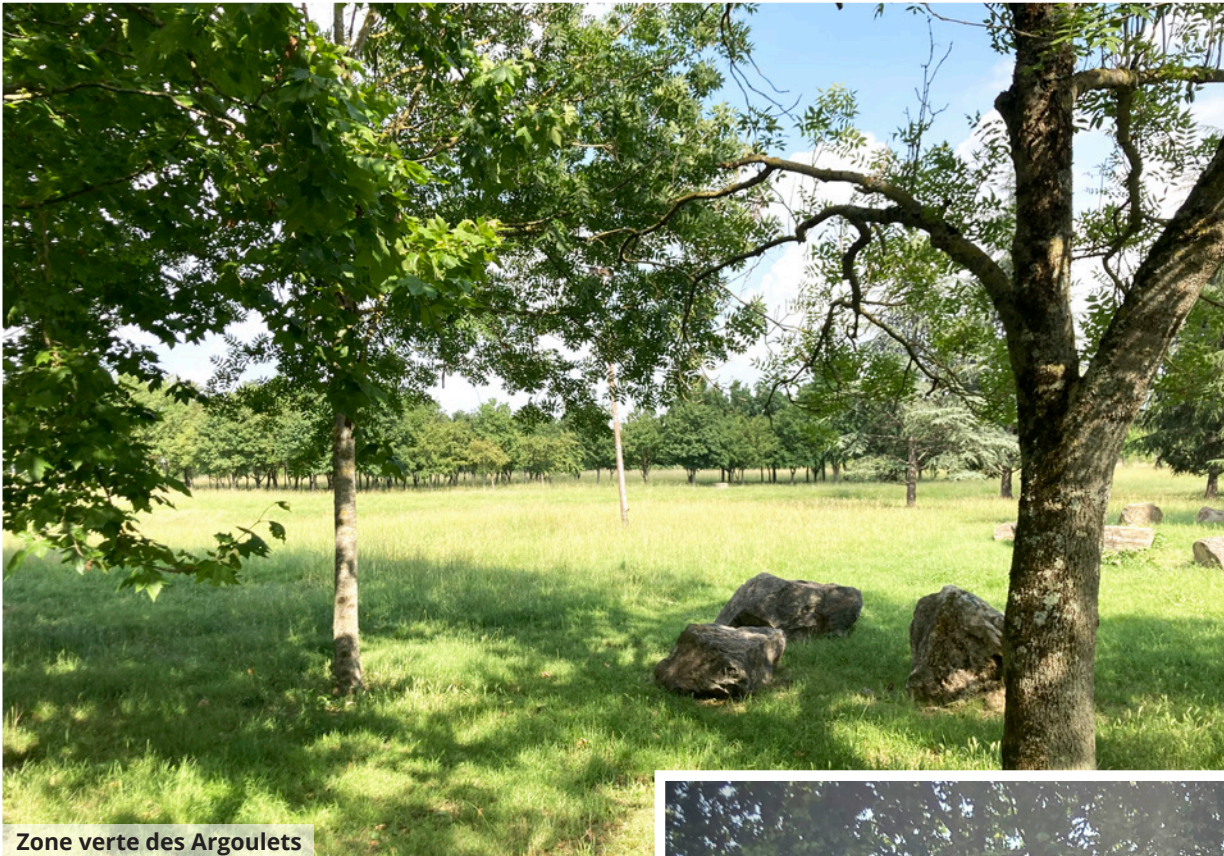
Zone verte des Argoulets