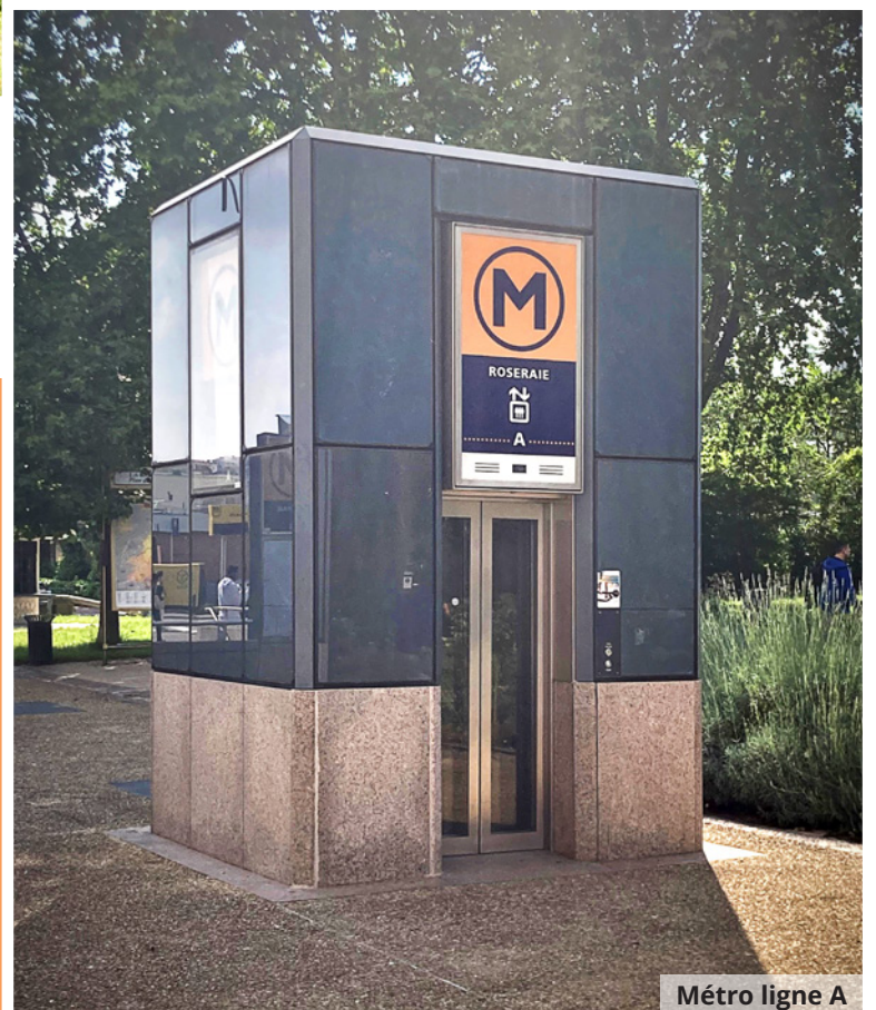
Métro ligne A