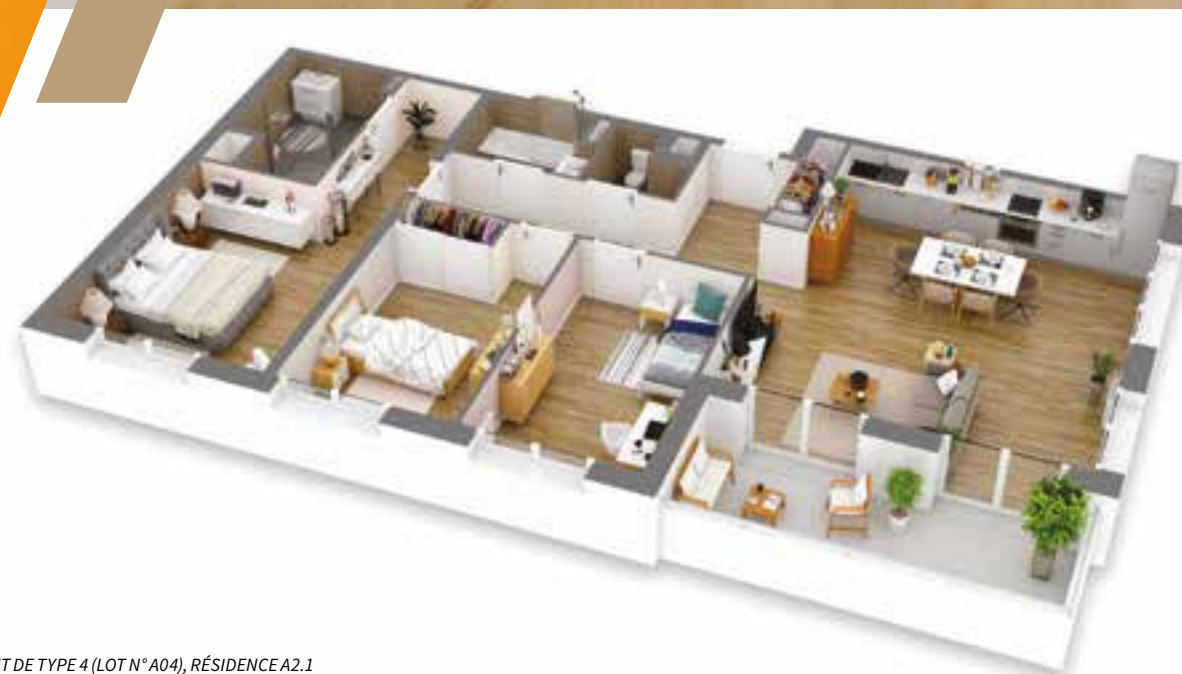
EXEMPLE D'UN LOGEMENT DE TYPE 4 (LOT N° A04), RÉSIDENCE A2.1