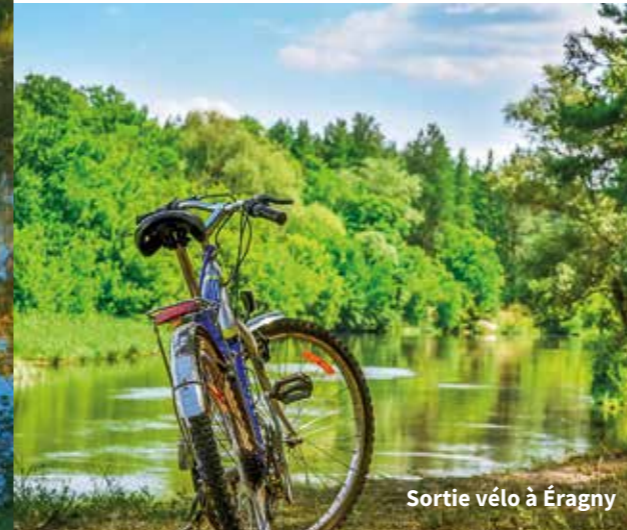
Sortie vélo à Éragny