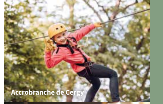
Accrobranche de Cergy