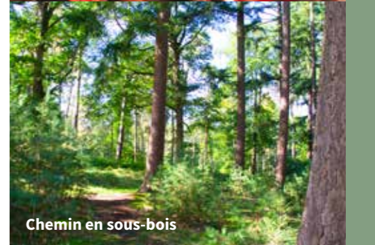
Chemin en sous-bois