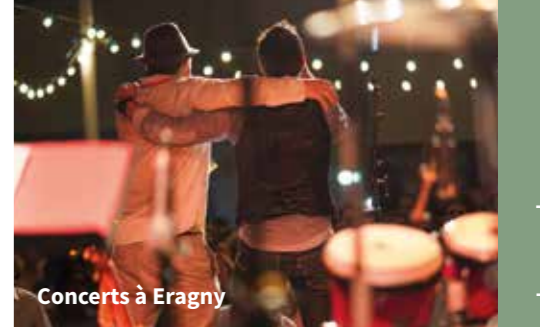
Concerts à Éragny