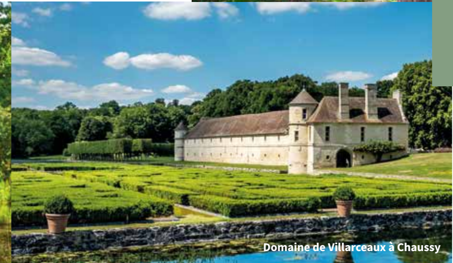
Domaine de Villarceaux à Chaussy