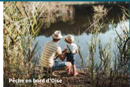
Pêche en bord d'Oise

À moins de 30 km de Paris, le Val-d'Oise offre une qualité de vie, de ville et de nature qui attire toujours plus de nouveaux arrivants.