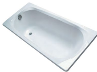
Exemple : Baignoire ULYSSE des établissements PORCHER. (les images sont non contractuelles)

Baignoire acrylique de 1m70x0.70m de type Ulysse de la marque PORCHER ou équivalent selon choix architecte. Les tabliers de baignoire seront faïencés.