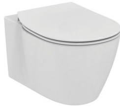
Exemple : Ensemble WC suspendu des établissements PORCHER (les images sont non contractuelles)