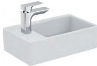
Exemple : Lave main de la gamme STRADA des établissements PORCHER (les images sont non contractuelles)

Lave-mains de type STRADA des établissements PORCHER ou équivalent. Avec robinet mono commande eau froide uniquement des établissements GROHE ou équivalent.