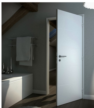
Exemple : Porte de la gamme ZEN FIBER des établissements MALERBA

Portes à âme alvéolaire pré-peinte ou laquée de 40mm avec parements rainurés de la gamme ZEN FIBER des établissements MALERBA ou équivalent selon choix architecte. La porte de séparation entre l'entrée et le séjour sera pourvue d'un oculus vitré.