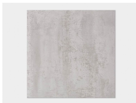
Exemple : Carrelage Série RODANO et FERROKER des établissements PORCELANOSA (les images sont non contractuelles)