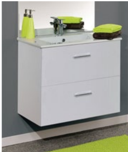
Exemple : Série ANGELO des établissements NEOVA (les images sont non contractuelles)

Meuble ensemble simple vasque de type Angelo des établissements NEOVA, ou ADELE des établissements ROCA, ou équivalent selon choix architecte avec miroir et luminaire et suivant réglementation d'accessibilité aux personnes à mobilité réduite.