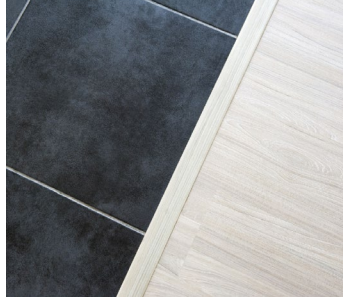
Exemple : cornière métallique entre le parquet et le carrelage

Un seuil de compensation métallique sera posé lors des jonctions entre carrelage et parquet.