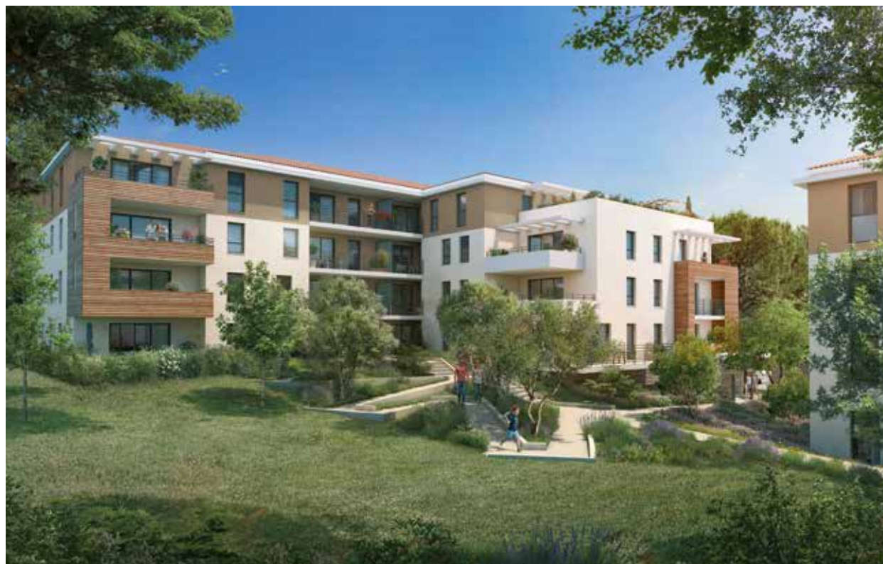
ARIA - Luynes

Conscient des urgences environnementales et sociales, Nacarat intervient / agit comme un interlocuteur privilégié aux côtés des habitants, des usagers et des élus. En détectant les potentialités d'un site pour lui donner de la valeur ajoutée, durablement, Nacarat co-construit des solutions aux problématiques urbaines et sociales d'aujourd'hui, en s'appuyant sur un écosystème innovant, pour un immobilier juste et durable.