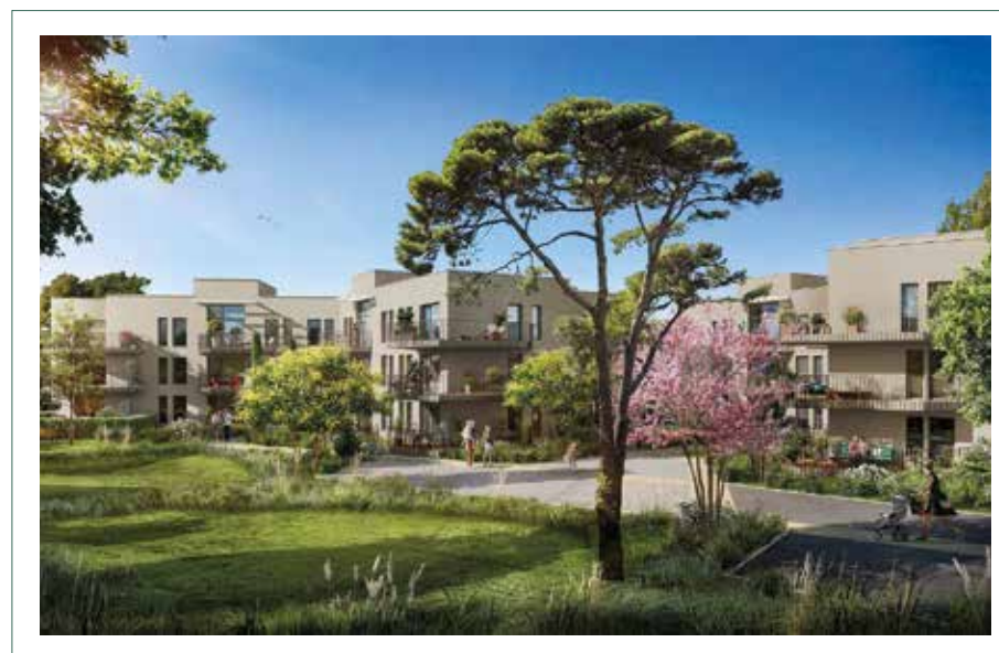
ARBOREA - Marseille 12/13 ème

Son nouveau nom est emprunté à un oiseau architecte qui construit des nids remarquables. L'agilité dont le tisserin fait preuve, la durabilité et le design de son habitat font écho à l'esprit qui anime le groupe aujourd'hui. Il dit aussi tout l'engagement de ses équipes pour une production de logements et de bureaux de qualité et vertueux sur le plan environnemental.