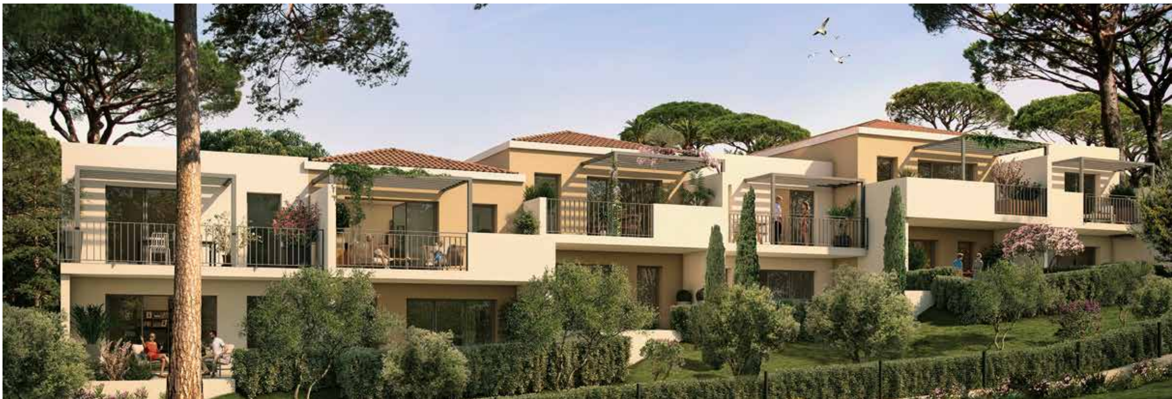
LA RESTANQUE - Aix-en-Provence