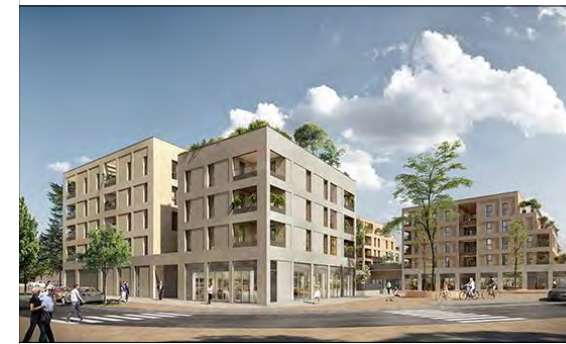
SNC DARDILLY ESPLANADE CDG 594 Avenue Willy Brandt - 59777 EURAILLE