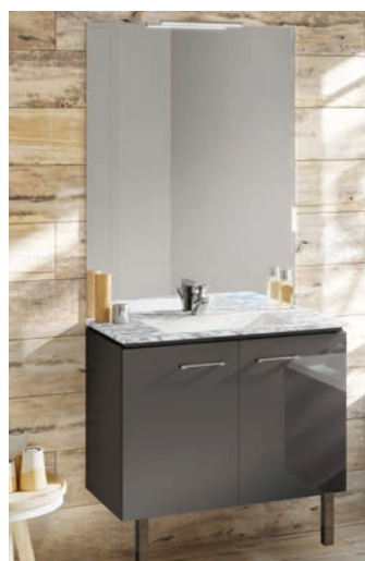
Meuble vasque L'élégance à la française Chêne Vert® Meuble 2 portes avec amorti à la fermeture. Dimensions selon le plan du logement. Meuble sur pieds en aluminium, miroir toute hauteur, applique chromée. Différentes harmonies possibles pour le meuble et son plan vasque.