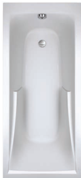
Baignoire Un moment de détente absolu Jacob Delafon® Suivant le plan du logement. Dimensions : 170x70 cm. Tablier Chêne Vert® en harmonie avec le meuble vasque.