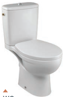
WC Une nécessité stylée Delafon Jacob Delafon® Blanc - Taille : 64,5x35,6 cm. Abattant Patio avec charnières métalliques. Mécanisme de chasse économiseur d'eau.