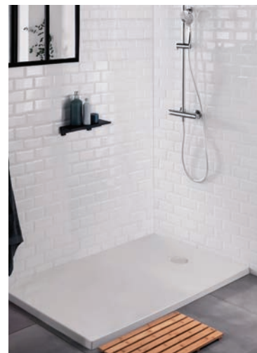
Receveur douche Alliance du style et du confort Jacob Delafon® Dimension : 90x120 cm. Céramique - blanc.