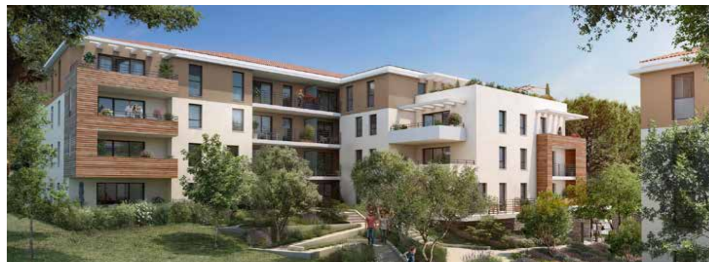
Aria à Luynes