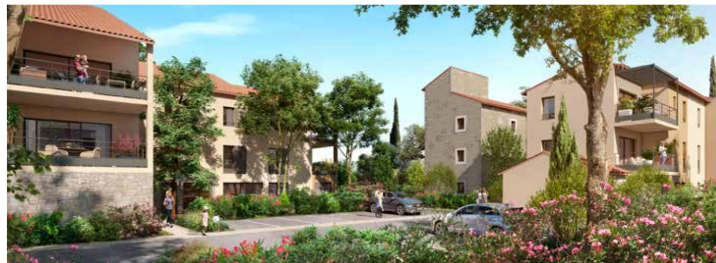
Domaine Saint Marc