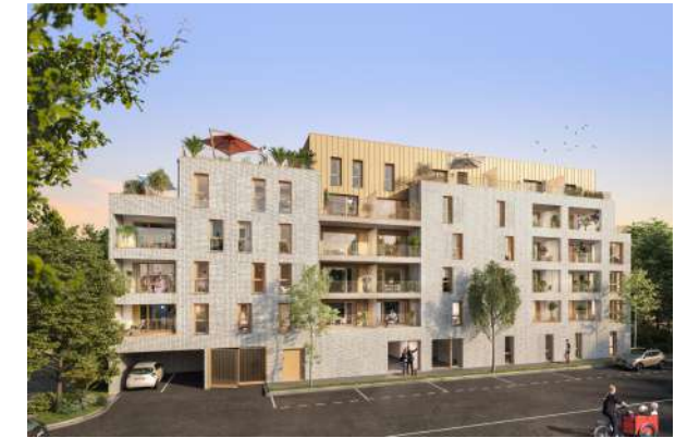
01_Plan de sous sol