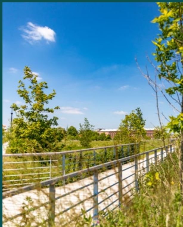
Parc de l'Union

Située à 20 minutes* de Lille et à quelques kilomètres de la frontière belge, la ville de Tourcoing s'inscrit dans la région dynamique de la Métropole Européenne de Lille.