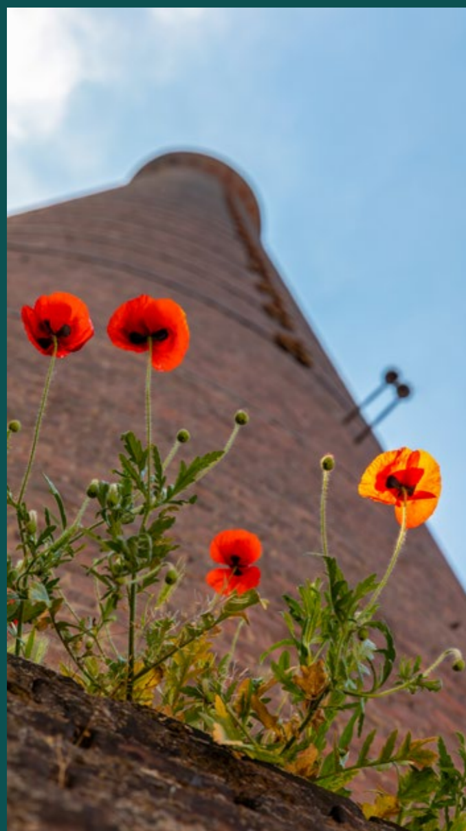
Le peignage de la Tossée

Aussi connue pour son patrimoine historique, Tourcoing accueille plusieurs bâtiments remarquables, tels que la Maison de la Photographie et l'église Saint-Christophe. Elle possède enfin plusieurs parcs et jardins, tels que le Jardin Botanique (11 000 m 2 ) et le Parc Clémenceau (11 hectares), ou encore le Parc de l'Union (10 hectares), véritables poumons verts au cœur de la ville.