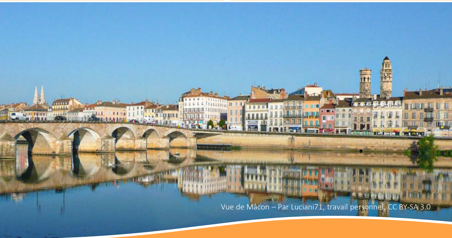
Vue de Mâcon