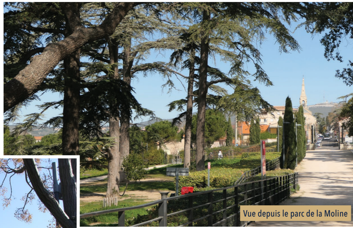
Vue depuis le parc de la Moline