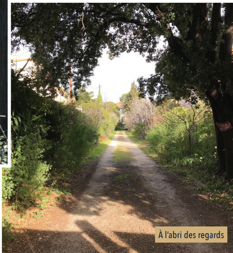
À l'abri des regards