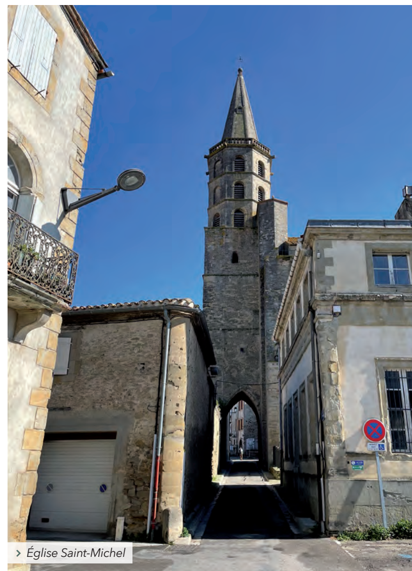
> Église Saint-Michel