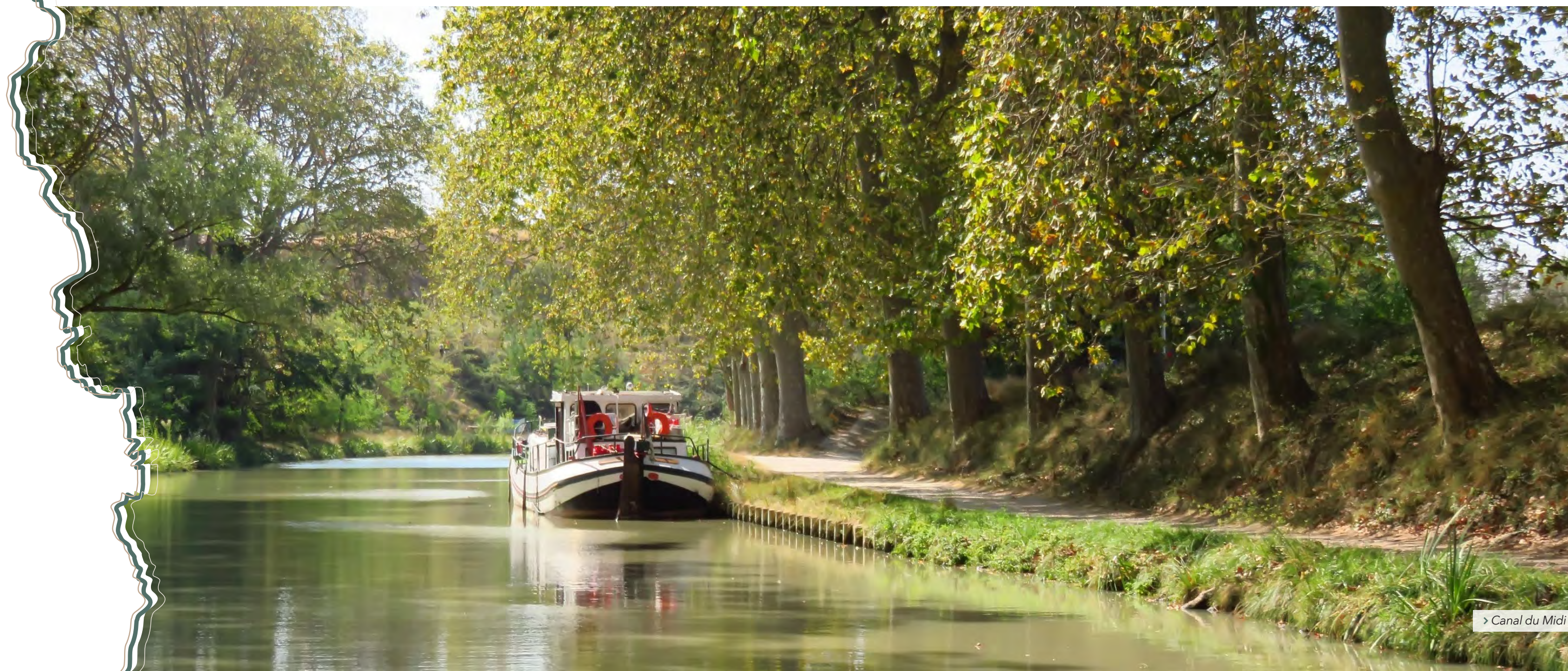
> Canal du Midi