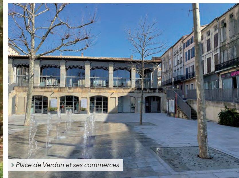
> Place de Verdun et ses commerces