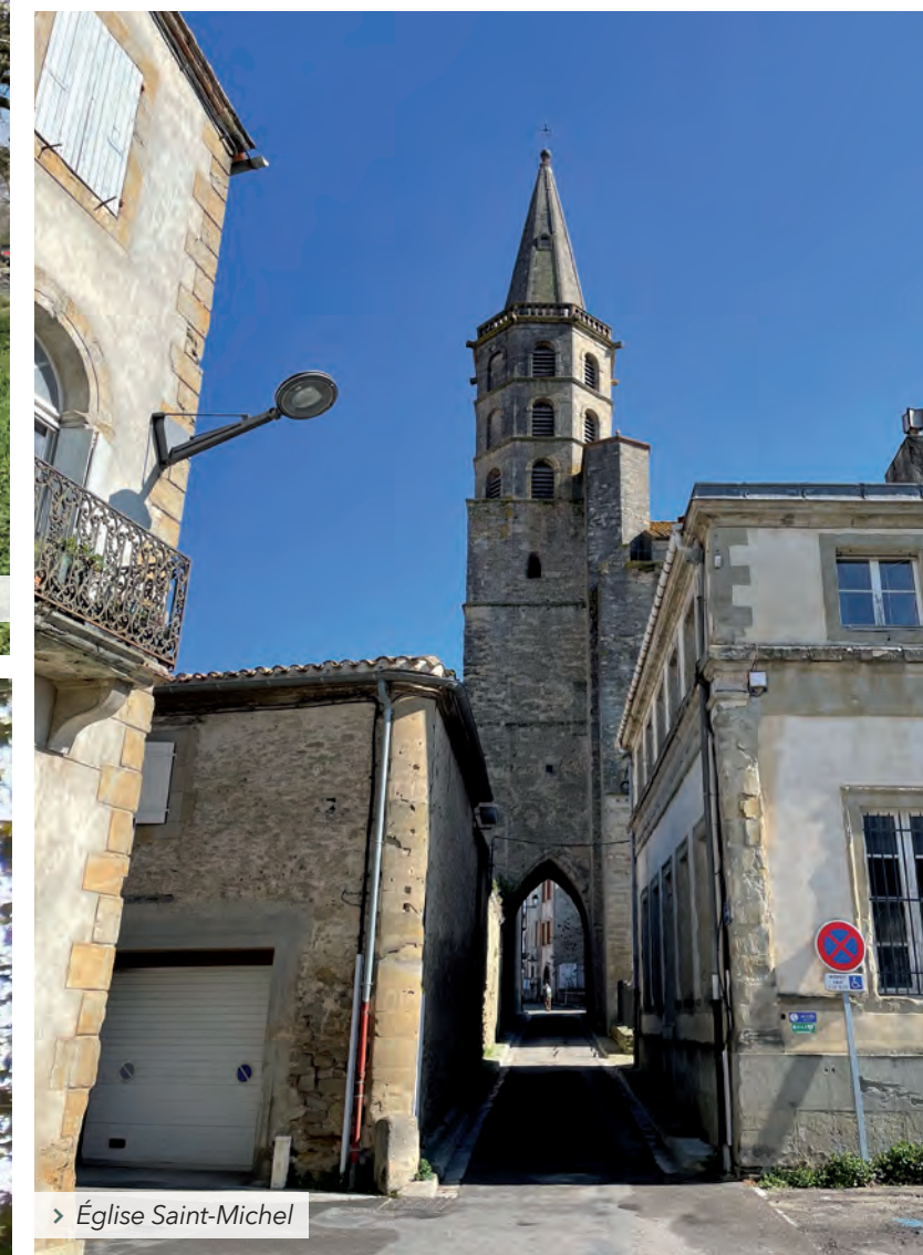
> Église Saint-Michel