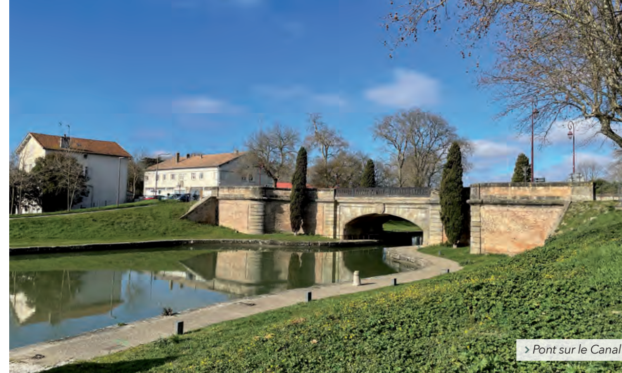
> Pont sur le Canal

Le charme de cette ville chargée d'histoire et tournée vers l'avenir est irrésistible tant son cadre de vie est plaisant.