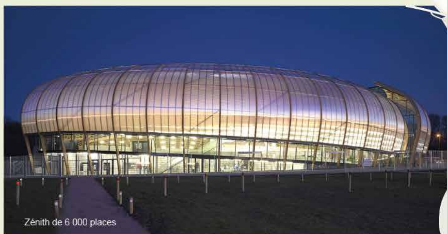
Zénith de 6 000 places