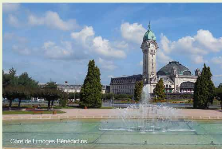
Gare de Limoges-Bénédictins