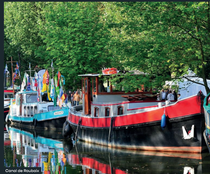
Canal de Roubaix