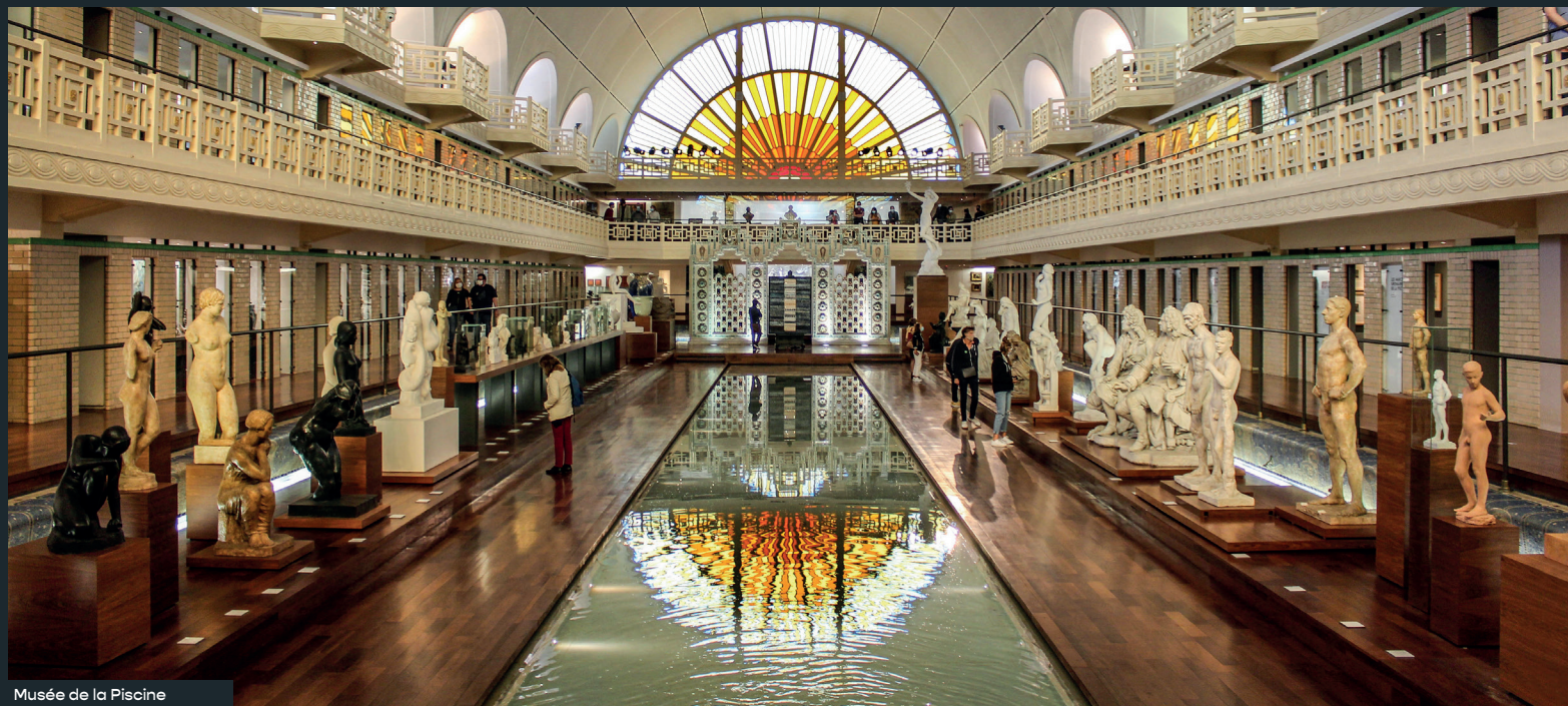
Musée de la Piscine