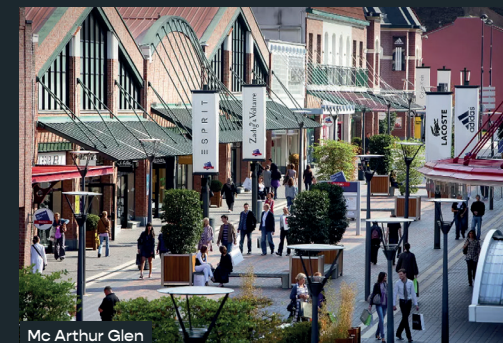
Mc Arthur Glen