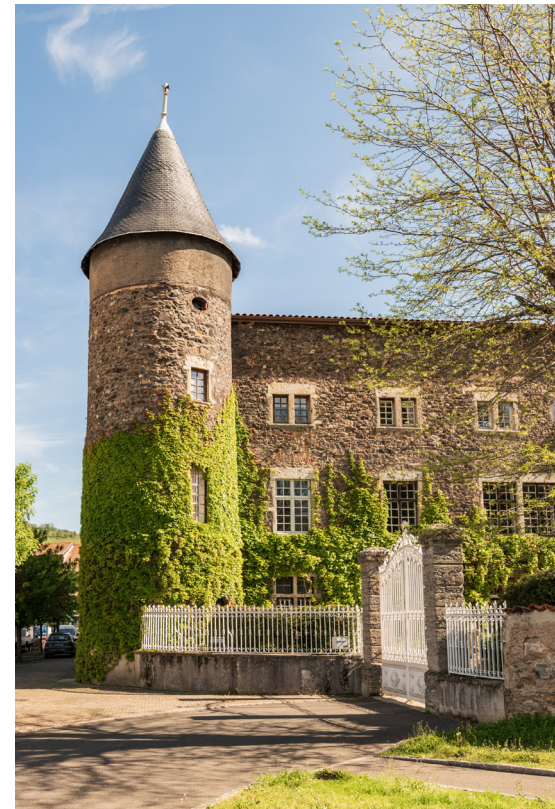
Château de Fenoyl