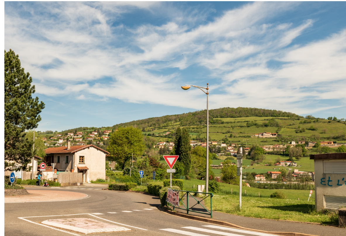
Vue sur les Monts du Lyonnais

Peuplés de fermes traditionnelles, de châteaux, de chapelles et d'églises romanes, de cours d'eau, de lacs et de plaines agricoles, de villages champêtres et de vestiges gallo-romains, les Monts du Lyonnais regorgent de trésors cachés... Plébiscitée pour ses grands espaces particulièrement bien préservés, véritable paradis pour les randonneurs, cette région naturelle est un lieu de vie à nul autre pareil. Pétri d'authenticité, marqué par des traditions paysannes qui font la fierté de ses habitants, ce territoire haut en couleurs séduit à bien des niveaux !