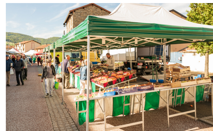
Le marché au cœur du village

Peuplés de fermes traditionnelles, de châteaux, de chapelles et d'églises romanes, de cours d'eau, de lacs et de plaines agricoles, de villages champêtres et de vestiges gallo-romains, les Monts du Lyonnais regorgent de trésors cachés... Plébiscitée pour ses grands espaces particulièrement bien préservés, véritable paradis pour les randonneurs, cette région naturelle est un lieu de vie à nul autre pareil. Pétri d'authenticité, marqué par des traditions paysannes qui font la fierté de ses habitants, ce territoire haut en couleurs séduit à bien des niveaux !