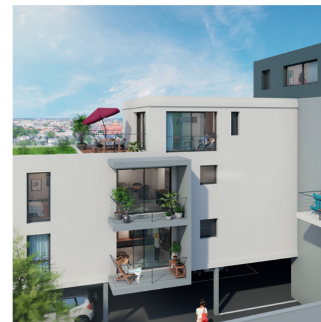
Le 84 – Nantes (44)