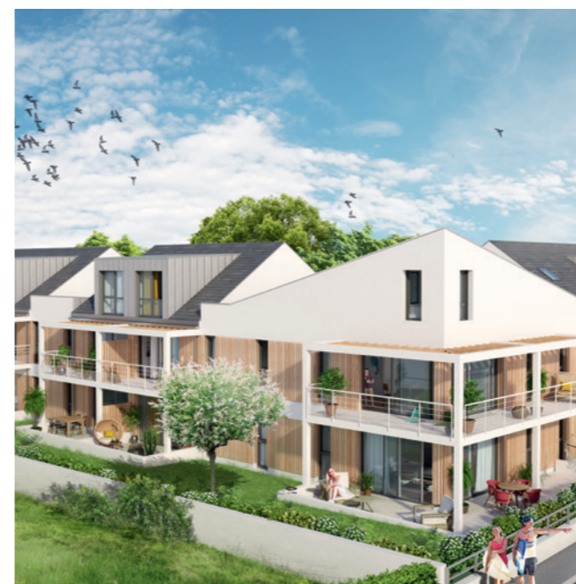
Villa Margaux – Bénodet (29)