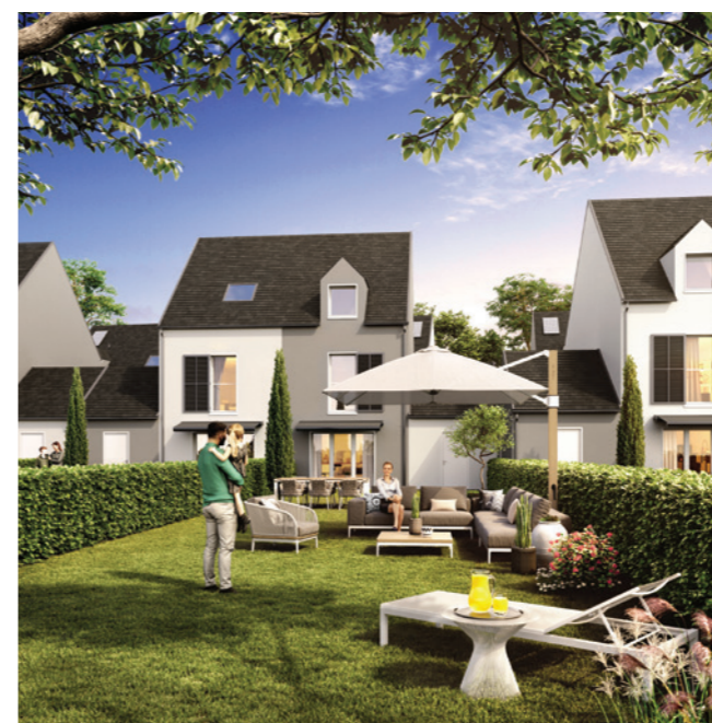
Les Villas d'Adrien – Etampes (91)