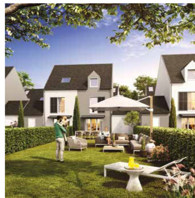
Les Villas d'Adrien – Etampes (91)