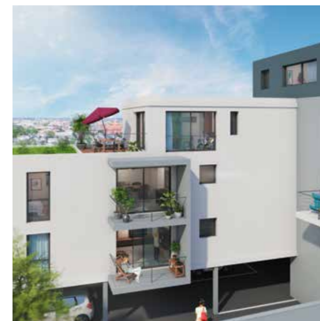
Le 84 – Nantes (44)