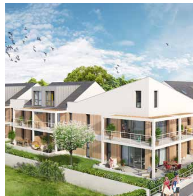
Villa Margaux – Bénodet (29)