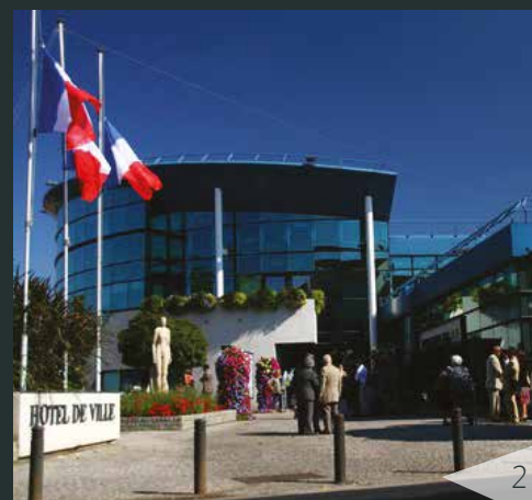
1. Gare RER de Savigny-sur-Orge 2. Mairie de Savigny-sur-Orge