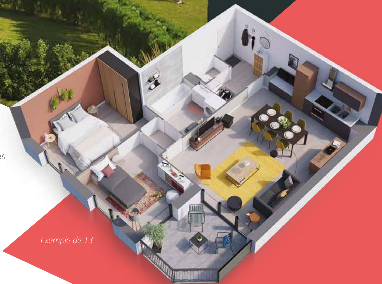
Exemple de T3