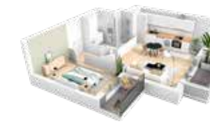
2 pièces (lot b108)