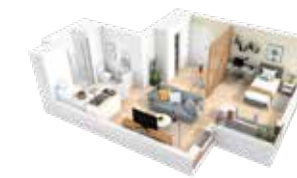
Studio (lot b410)