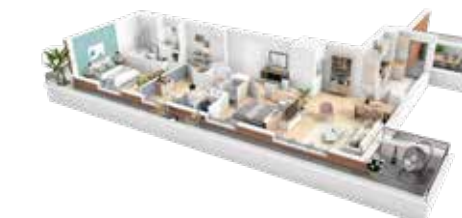
4 pièces (lot b501)