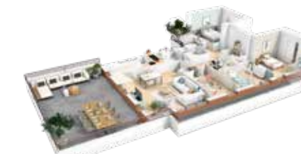
5 pièces (lot b503)