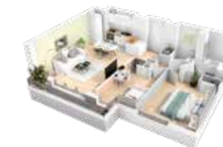
3 pièces (lot b105)