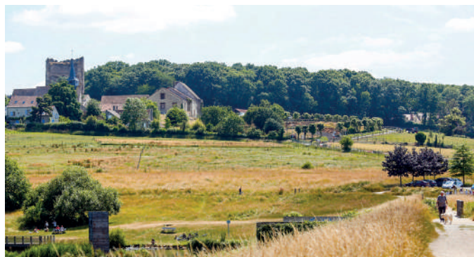
Vue du donjon de Maurepas