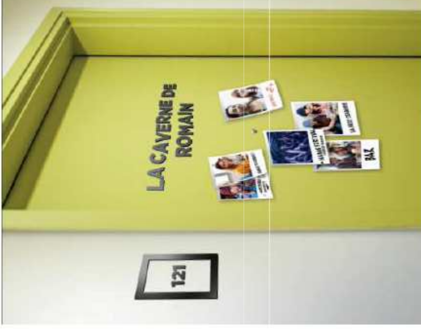
Signalétique : plaque en Plexiglas transparente + cadre et textes en adhésifs noirs Police : Gotham ou Montserrat