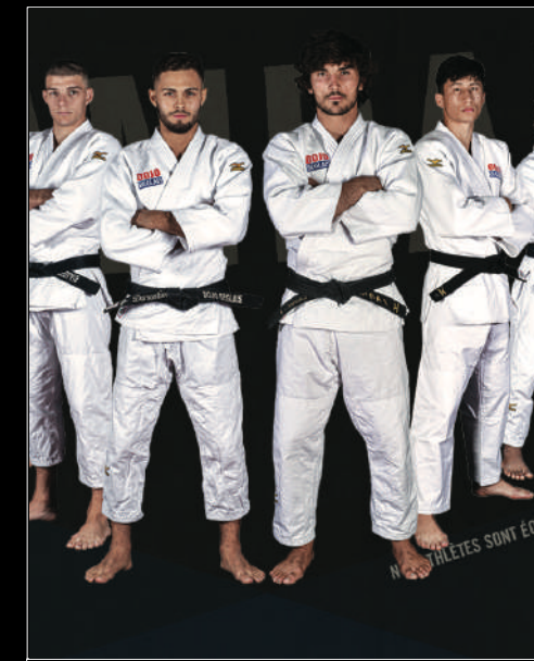
🍷 Dojo Béglais

Coliving destinée à prioriser l'accès au logement des sportifs de l'élite via une convention tripartite entre Harvey, la Mairie et le club d'Athlétisme.