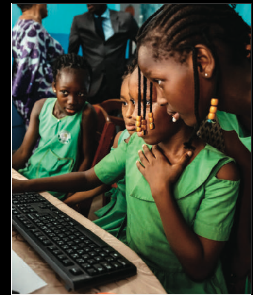
🍷 Fondation Ippon

Accompagnement du Dojo Béglais dans la préparation de ses athlètes dans le cadre du projet olympique 2024 à Paris.