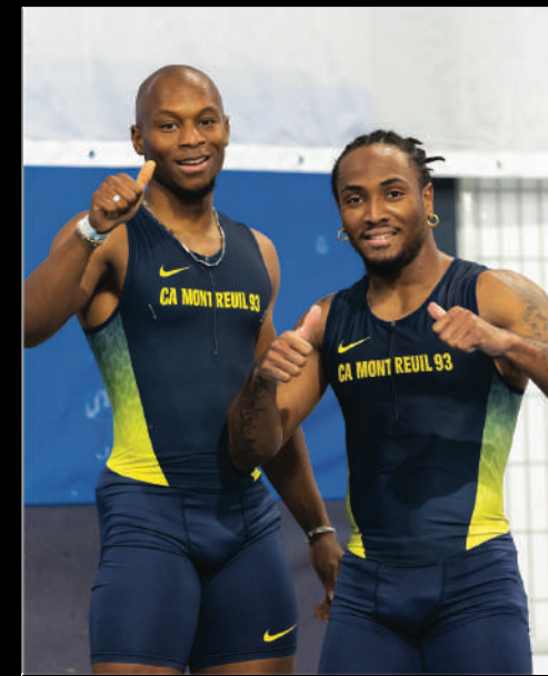
🍷 Coliving Montreuil

Accompagnement post-carrière par un contrat de reconversion chez Harvey suite à la retraite sportive.