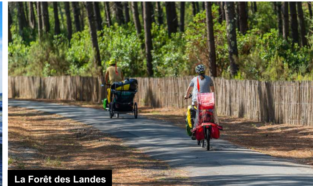
La Forêt des Landes

A 7 km du centre-ville, Biscarrosse possède trois lacs reliés par un canal : • le lac de Biscarrosse - Cazaux - Sanguinet (le lac Nord) offre les joies de la baignade et des sports nautiques, • le petit lac, plus sauvage et protégé, • le lac de Biscarrosse-Parentis, une des rares hydrobases françaises, également lieu favori des pêcheurs.