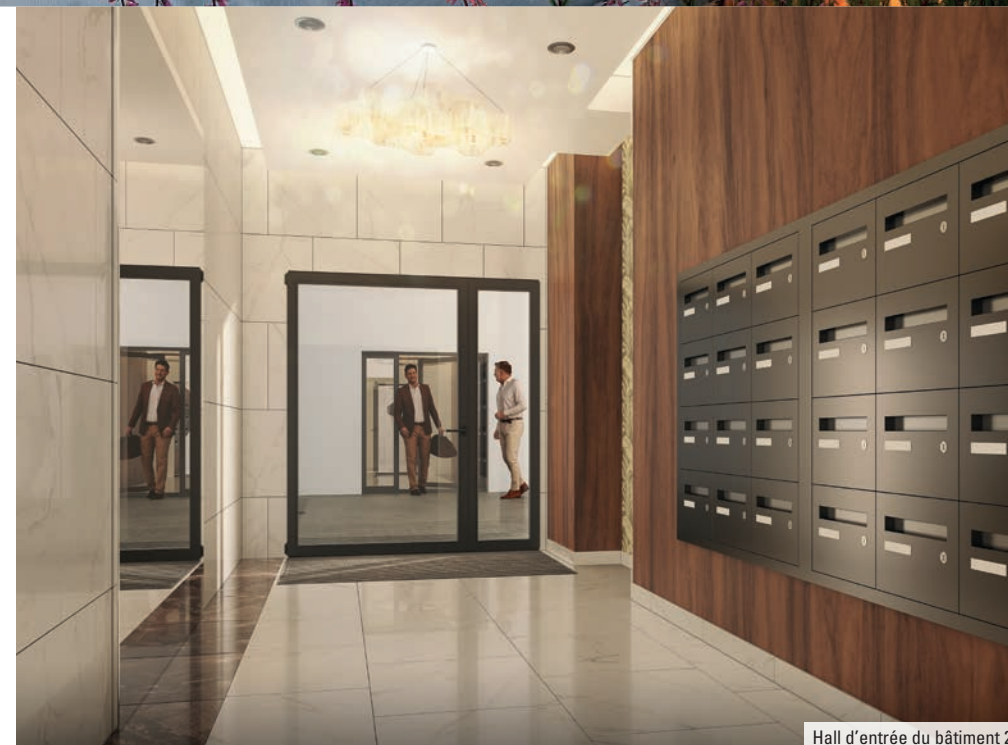
Hall d'entrée du bâtiment 2

Enfin, parmi le large choix d'appartements, des duplex de 4 ou 5 pièces séduisent par leurs surfaces allant jusqu'à 115 m 2 .