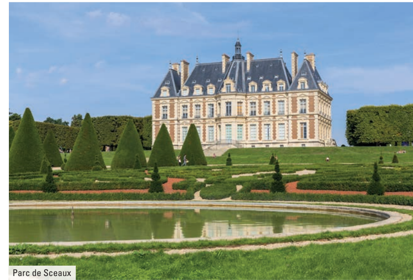
Parc de Sceaux

En cœur de ville, les rues commerçantes et les allées du marché promettent une vie pratique et animée. Toute l'année, les activités culturelles et sportives sont multiples et contribuent à l'épanouissement des petits et grands. Engagée dans la Métropole du Grand Paris, la ville conforte son rayonnement en accueillant bientôt le Tramway T10, qui rejoindra la gare RER B La Croix de Berny en 3 minutes* seulement.