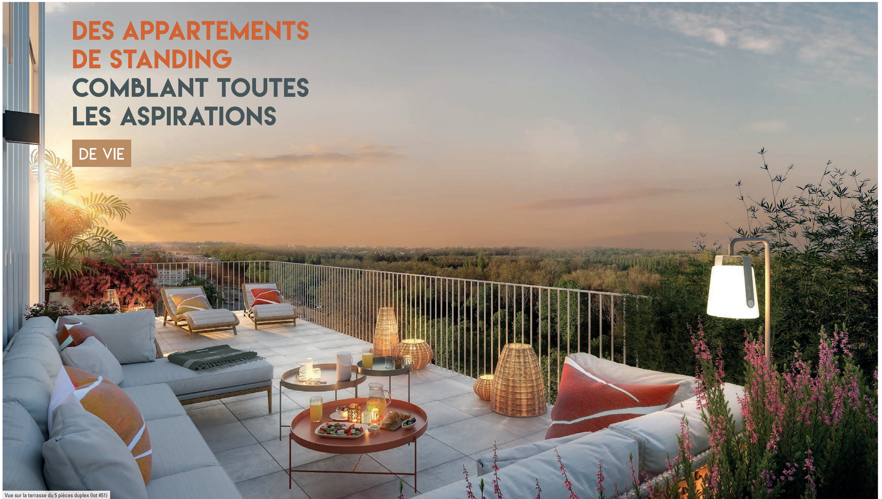
Vue sur la terrasse du 5 pièces duplex (lot 451)

Perle du Parc dévoile ses appartements déclinés du studio au 5 pièces duplex. Les familles et les couples peuvent ainsi choisir un logement à leur mesure et profiter d'un confort durable.