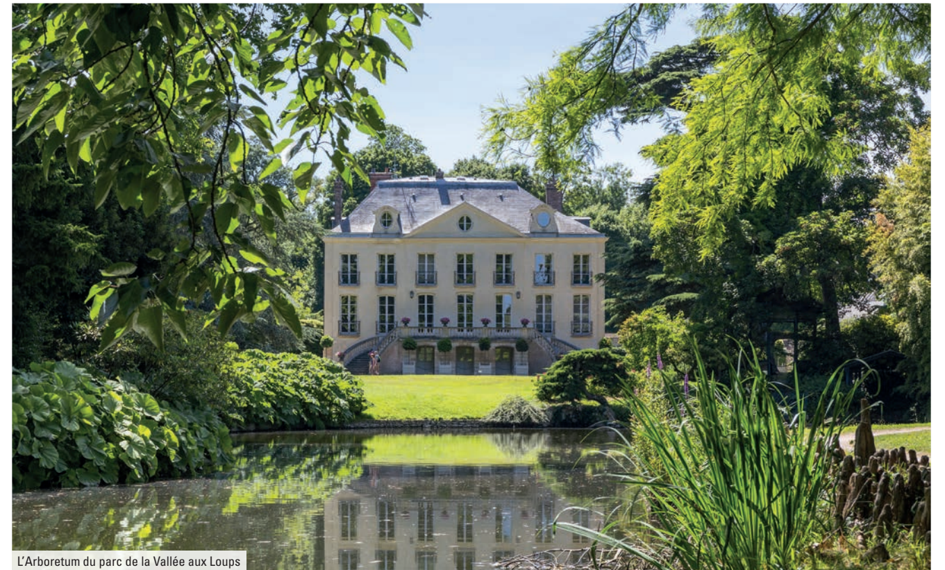
L'Arboretum du parc de la Vallée aux Loups