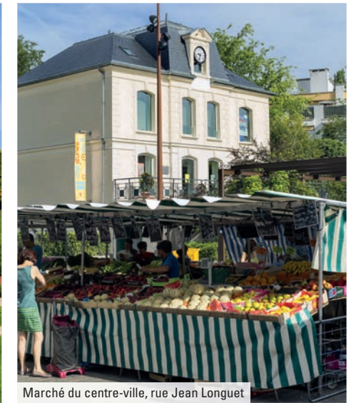
Marché du centre-ville, rue Jean Longuet