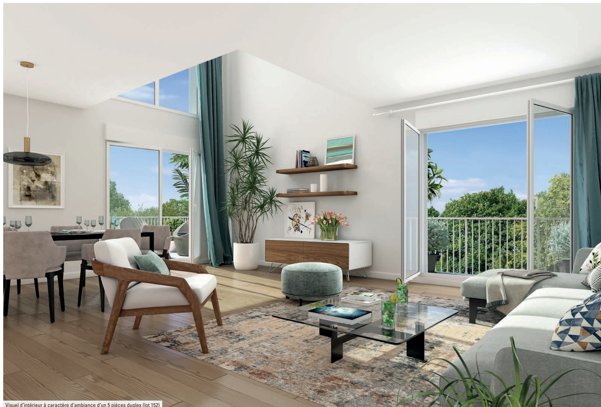
Visuel d'intérieur à caractère d'ambiance d'un 5 pièces duplex (lot 152)