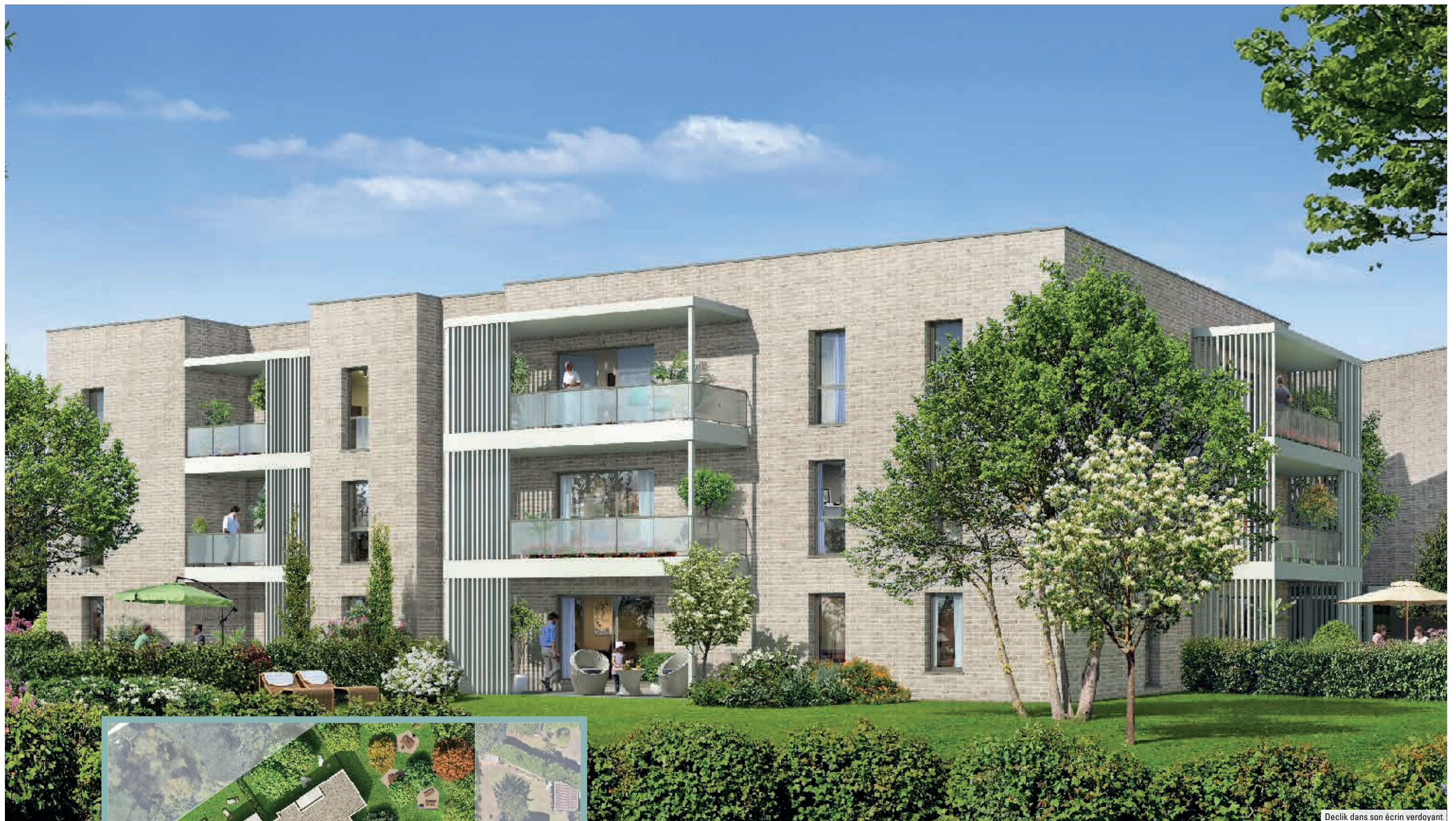
Declik dans son écrin verdoyant