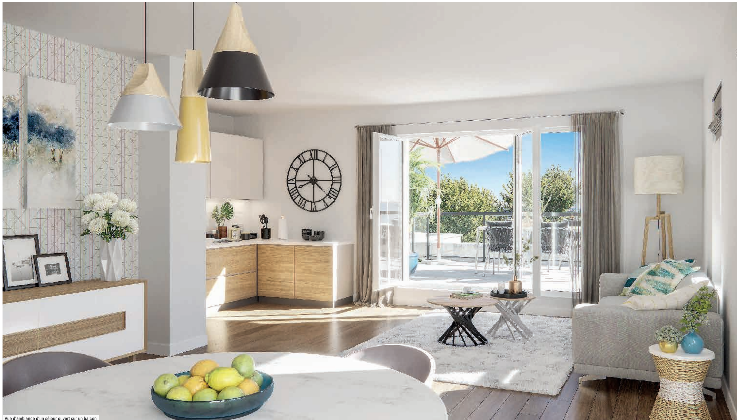
Vue d'ambiance d'un séjour ouvert sur un balcon