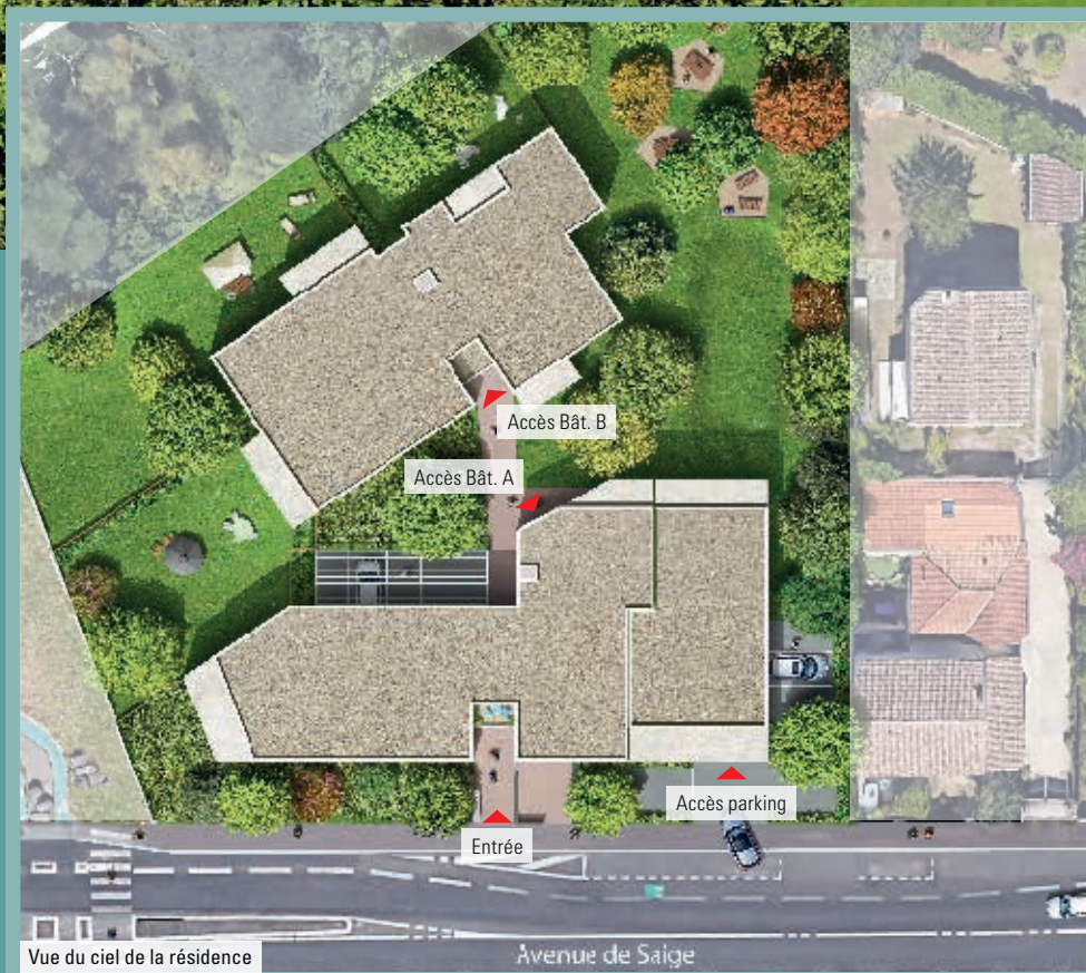
Vue du ciel de la résidence