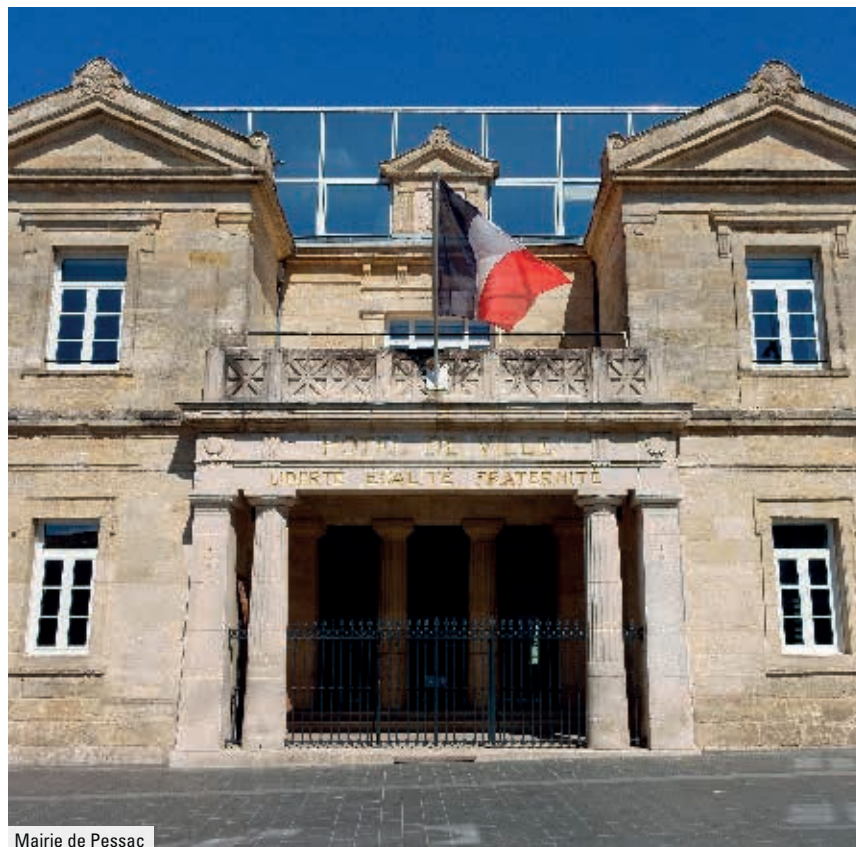
Mairie de Pessac