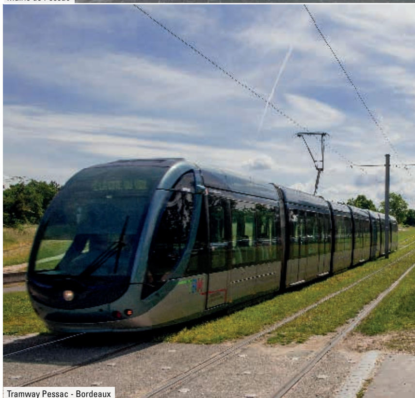
Tramway Pessac - Bordeaux